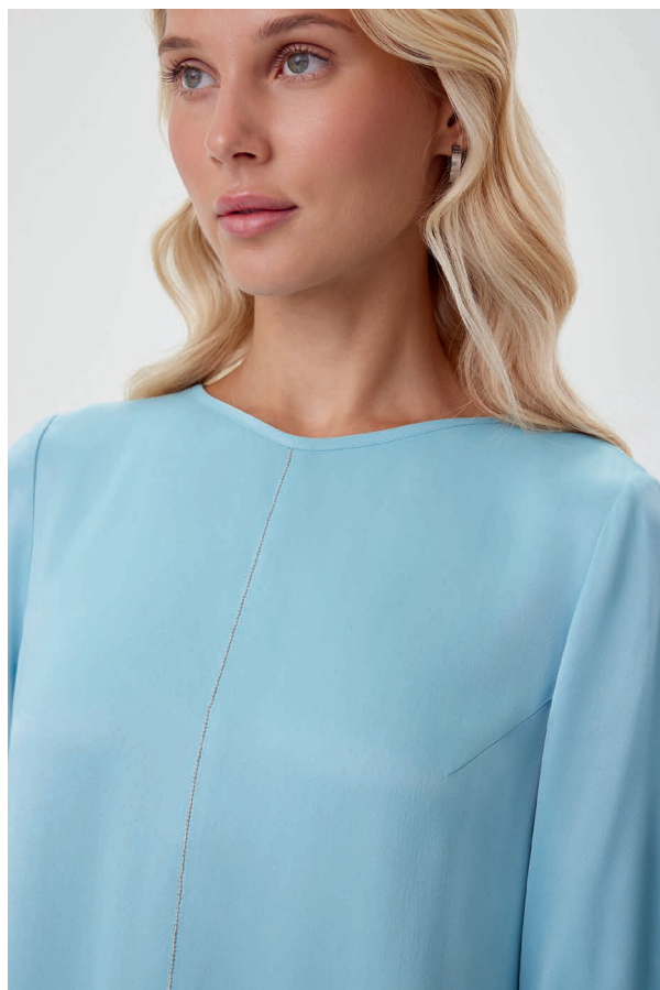
21-01-025 Платье «Лазурная прогулка»