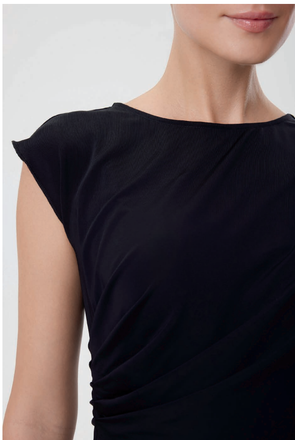
21-09-256 Блузка «Летний вечер»