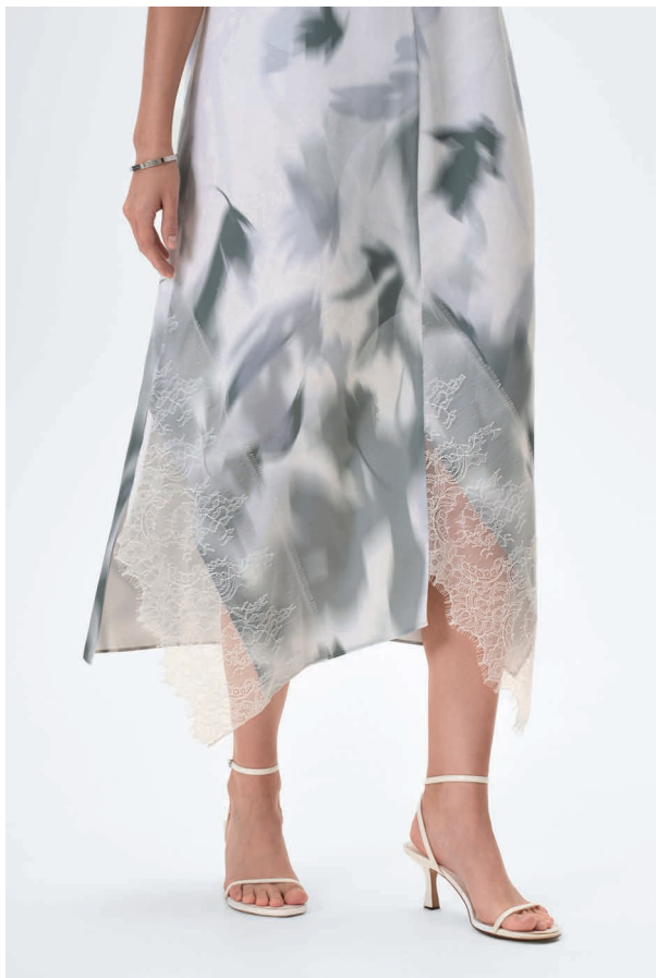
21-09-266 Платье «Силуэты сада»