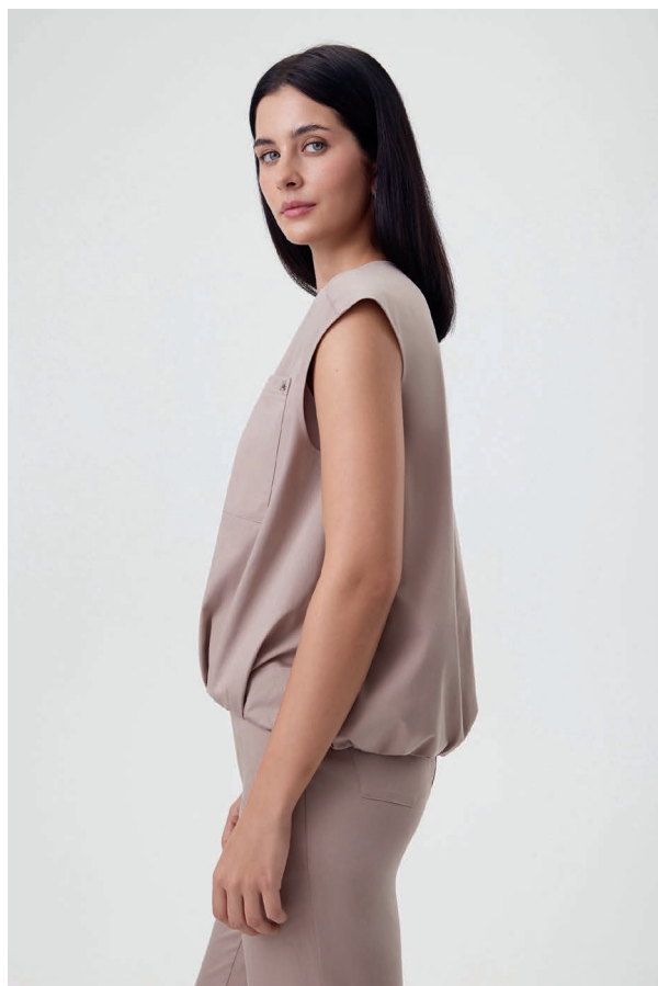
21-08-212 Жилет «Оттенки миндаля» 21-08-222 Брюки «Оттенки миндаля»