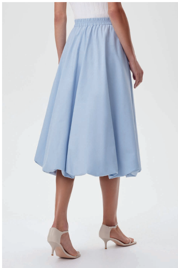
21-11-315 Топ вязаный «Летние истории» 21-11-307 Юбка «Летние истории»