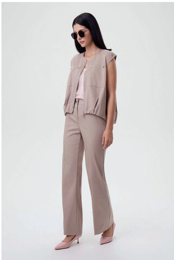
21-08-212 Жилет «Оттенки миндаля» 21-08-227 Топ «Оттенки миндаля» 21-08-222 Брюки «Оттенки миндаля»