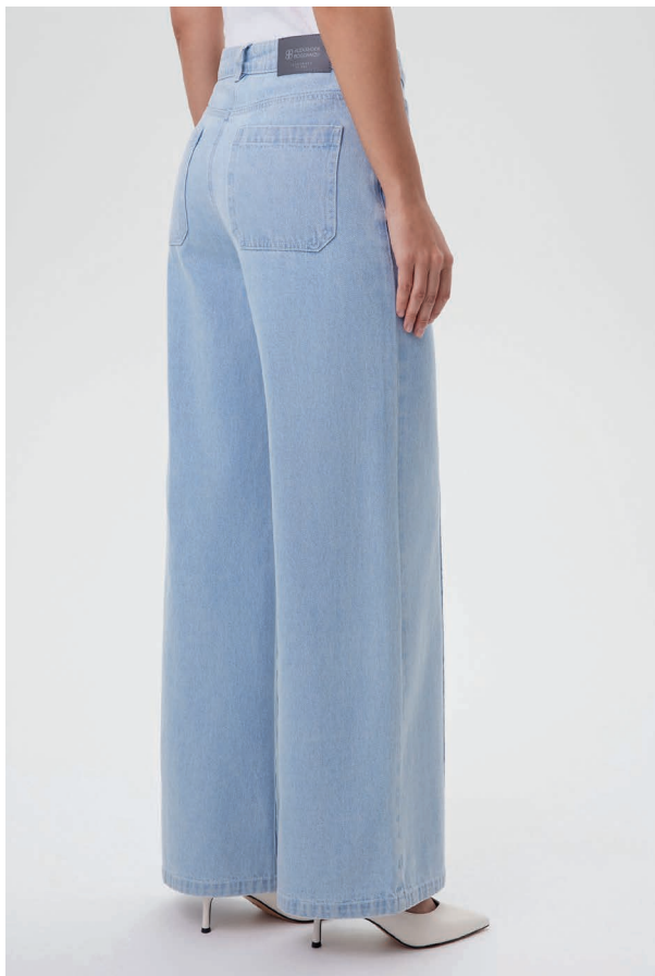
21-03-065 Топ вязаный белый 21-03-069 Брюки джинсовые «Городской полдень»