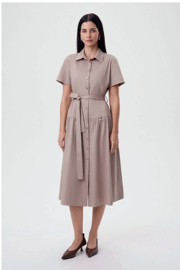
21-08-215 Платье с поясом «Оттенки миндаля»