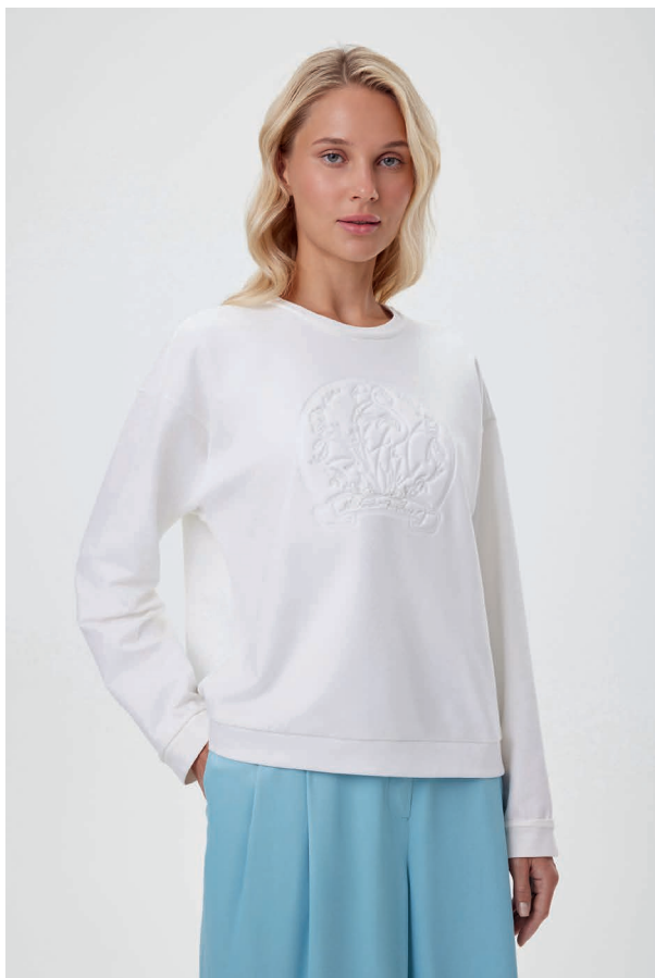
21-01-005 Свитшот «Жемчужный мускат» 21-01-011 Брюки «Лазурная прогулка»