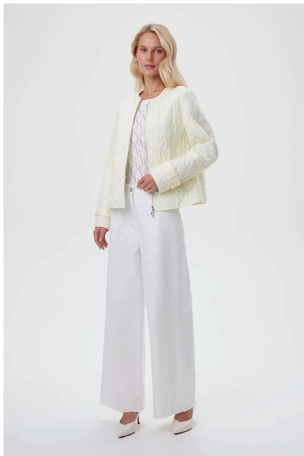
21-05-120 Куртка «Солнечный взгляд» 21-05-140 Джемпер «Капель» 21-05-129 Брюки джинсовые «Капель»