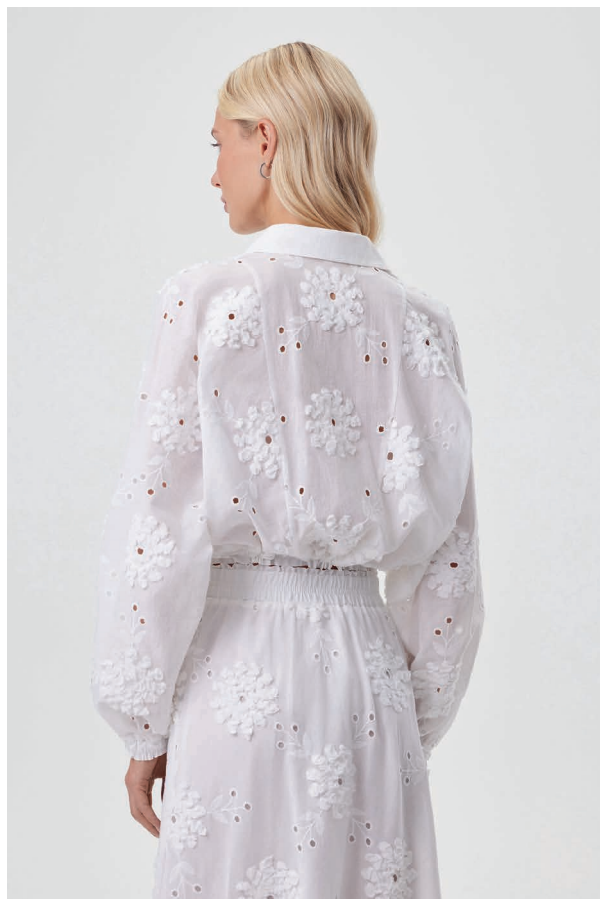
21-11-312 Блузон на пуговицах «Белый сад» 21-11-313 Юбка «Белый сад»