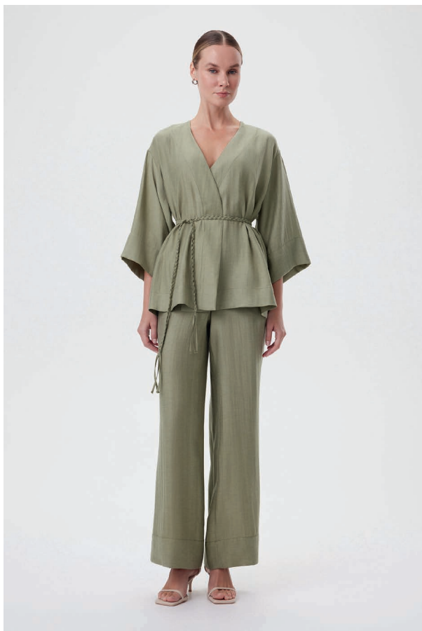
21-09-240 Жакет с поясом «Олива» 21-09-242 Брюки «Олива»