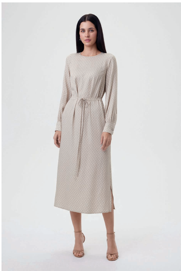
21-04-109 Платье «Жемчужный мускат»