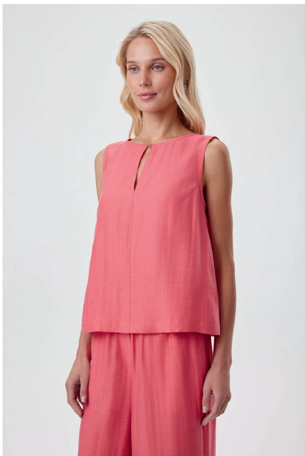
21-10-271 Топ «Вкус лета» 21-10-272 Брюки «Вкус лета»