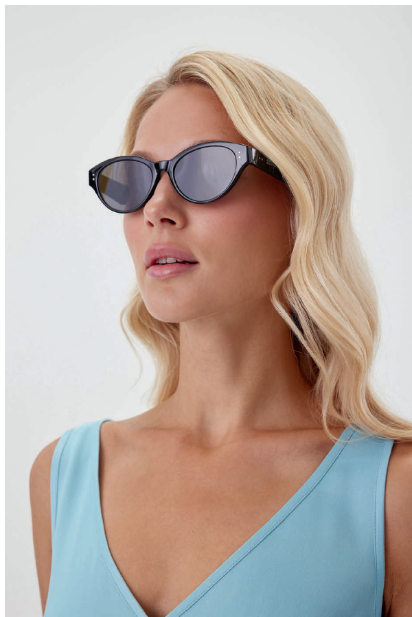
21-01-018 Платье без рукавов «Лазурная прогулка» 09-01-018 Очки чёрные кошачий глаз с футляром