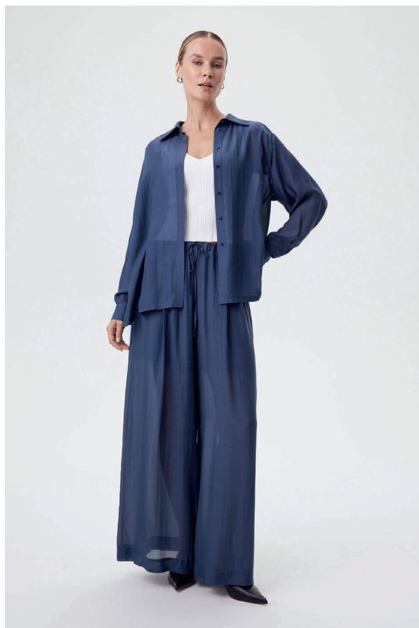
21-11-310 Блузка «Лунный сапфир» 21-11-315 Топ вязаный «Летние истории» 21-11-305 Брюки «Лунный сапфир»