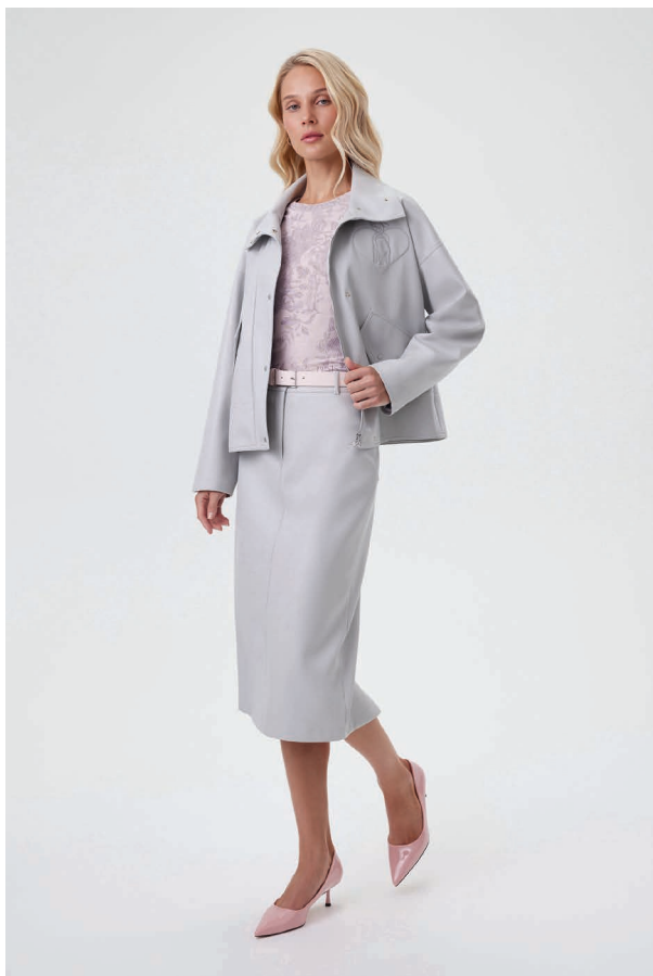
21-02-034 Куртка серая «Семейные ценности» 21-02-037 Джемпер «Розовые мечты» 21-02-044 Юбка серая «Семейные ценности» 07-01-054 Пояс АВ пудровый 3 см