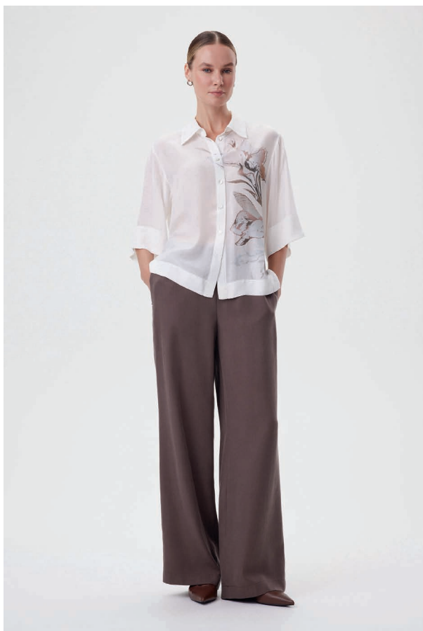
21-07-183 Блузка «Осязание» 21-07-190 Брюки шоколадные