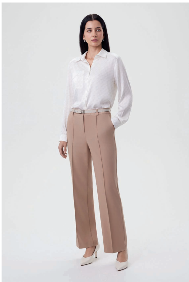
21-01-003 Блузка «Жемчужный мускат» 21-01-021 Брюки «Жемчужный мускат»