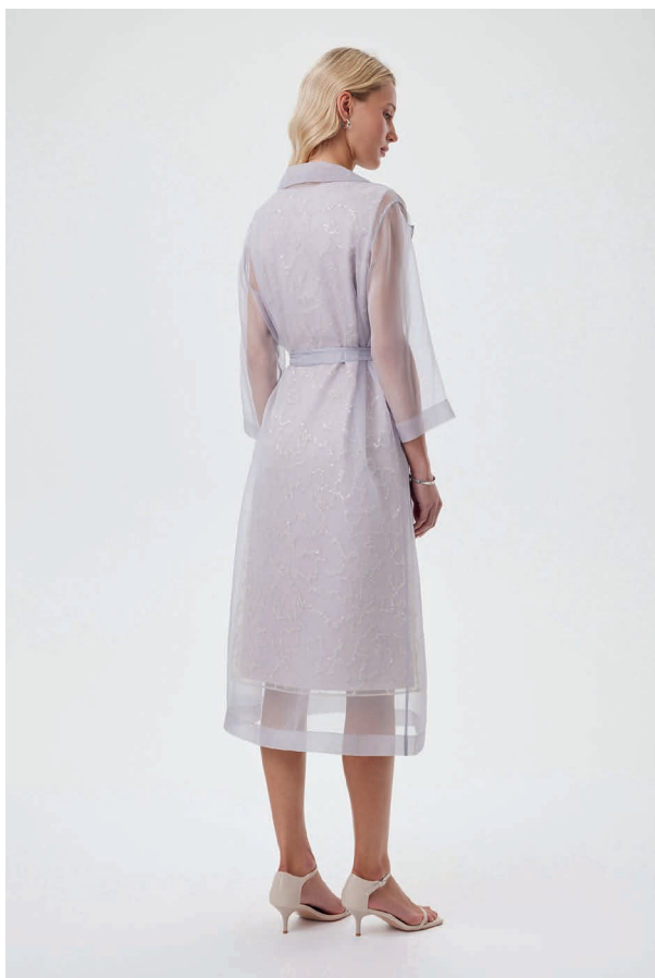
21-11-321 Тренчкот «Лунная вуаль» 21-11-320 Платье «Лунная вуаль»