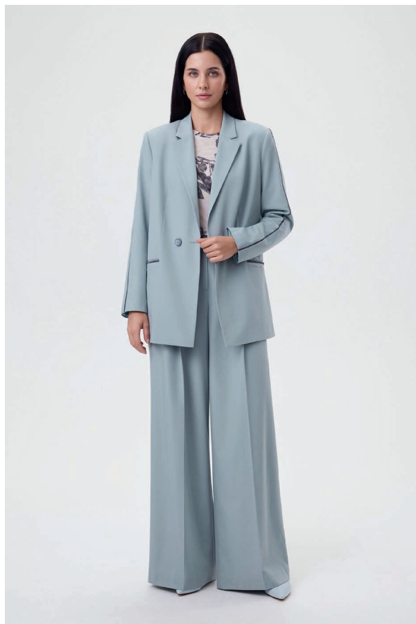
21-04-091 Жакет «Триумфальные аллеи» 21-04-108 Джемпер «Силуэт весны» 21-04-092 Брюки широкие «Триумфальные аллеи»