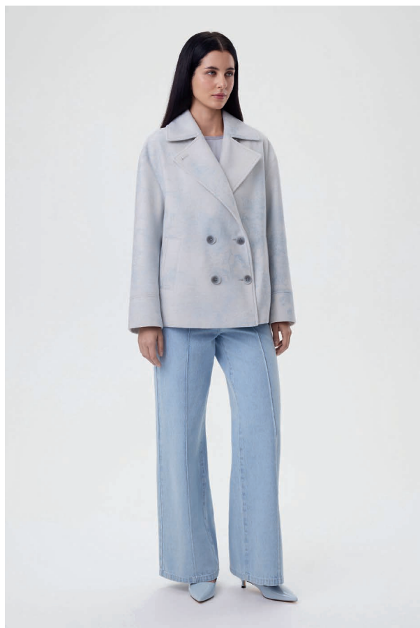
21-03-073 Пальто «Лунный иней» 21-03-067 Топ серебряный 21-03-069 Брюки джинсовые «Городской полдень»