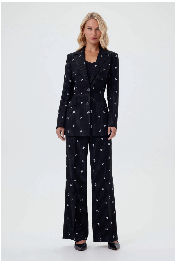
21-06-154 Жакет «Тёплые ночи» 21-06-166 Топ «Тёплые ночи» 21-06-155 Брюки «Тёплые ночи»