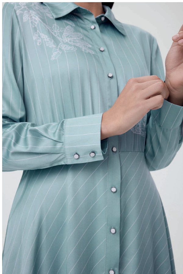
21-04-104 Платье «Триумфальные аллеи»