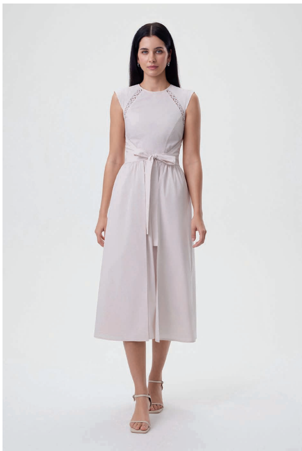
21-08-211 Платье «Оттенки миндаля»