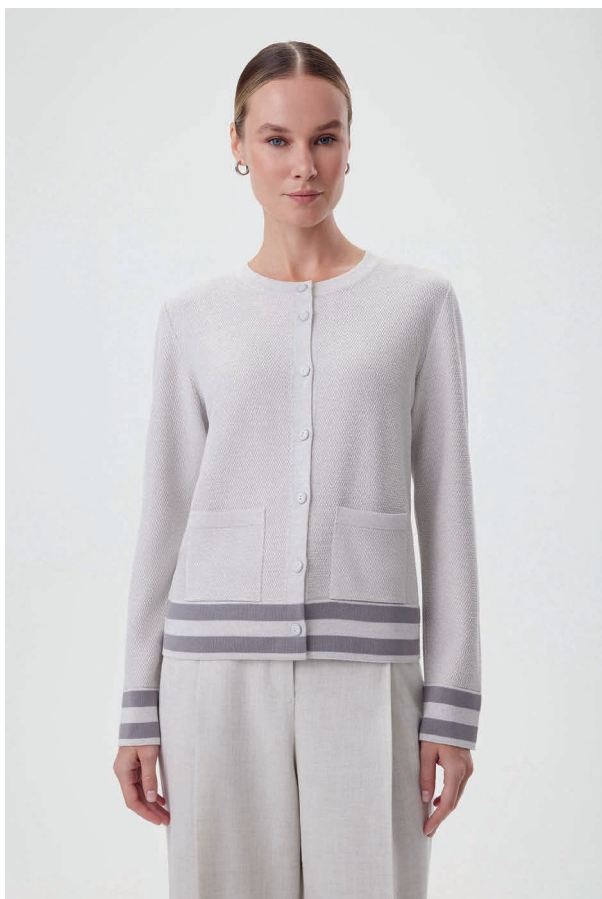
21-07-184 Джемпер на пуговицах «Осязание» 21-07-189 Брюки «Осязание»