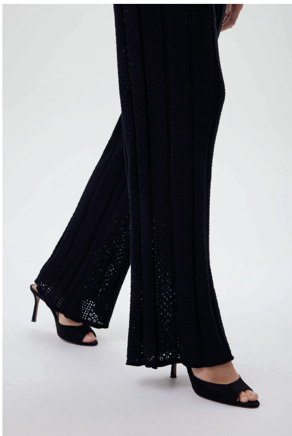
21-06-163 Брюки вязаные «Тёплые ночи»