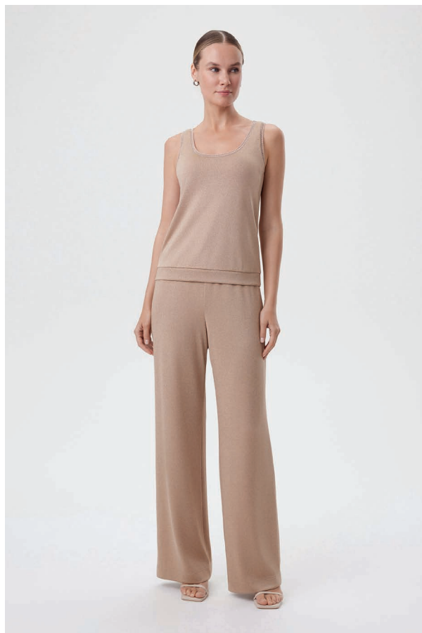
21-09-262 Топ «Золотая дюна» 21-09-261 Брюки «Золотая дюна»