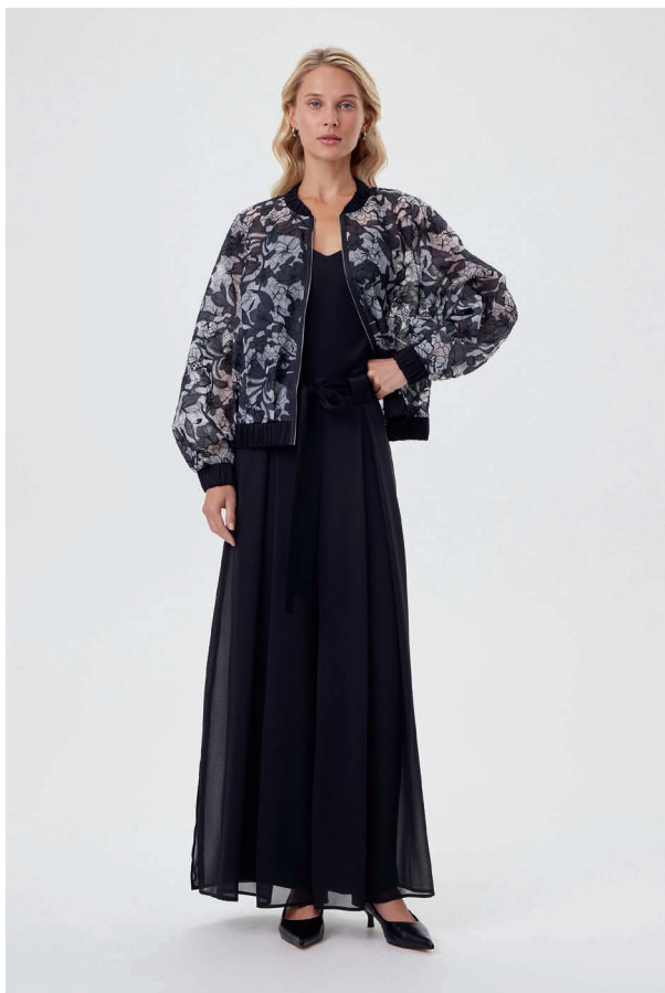
21-06-156 Блузон на молнии «Тёплые ночи» 21-06-166 Топ «Тёплые ночи» 21-06-159 Брюки с поясом «Тёплые ночи»