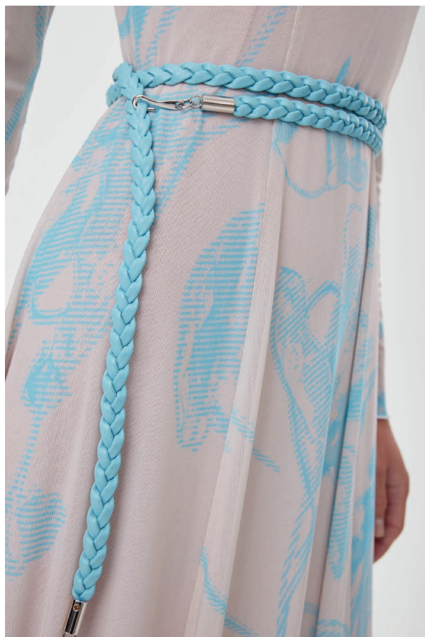
21-01-019 Платье «Весенний бутон» 07-01-059 Пояс коса бирюзовый