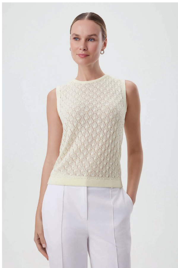
21-05-141 Топ «Солнечный взгляд» 21-05-144 Брюки белые