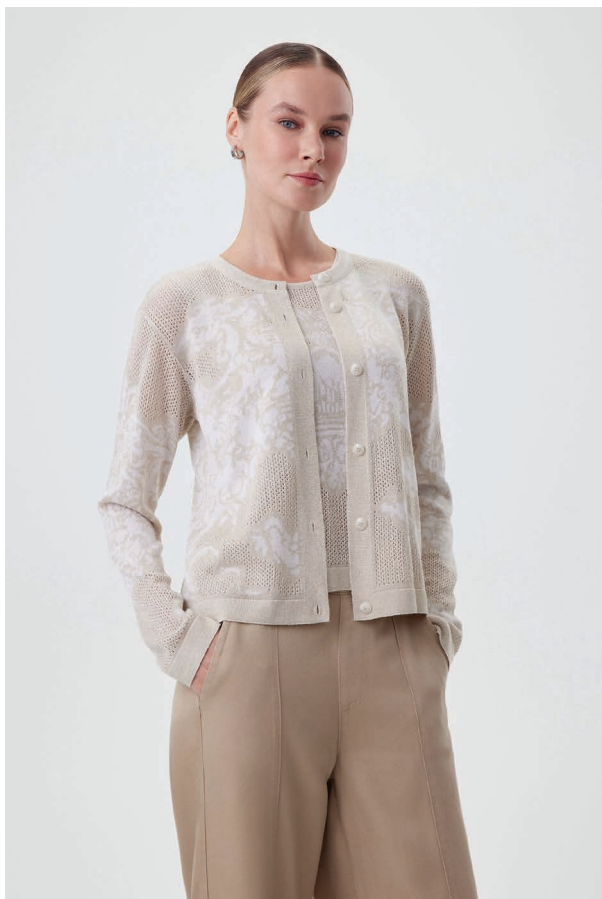
21-04-102 Джемпер «Триумфальные аллеи» 21-04-103 Топ вязаный «Триумфальные аллеи» 21-04-098 Брюки «Дуэт»