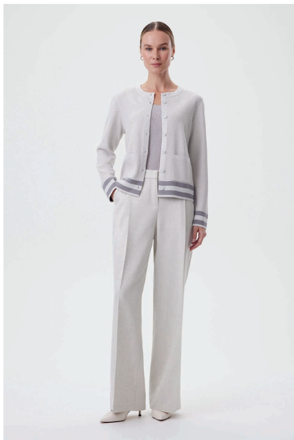
21-07-184 Джемпер на пуговицах «Осязание» 21-07-185 Топ вязаный «Осязание» 21-07-189 Брюки «Осязание»