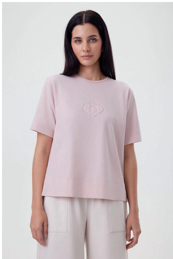
21-08-225 Футболка «Оттенки миндаля» 21-08-221 Шорты «Оттенки миндаля»