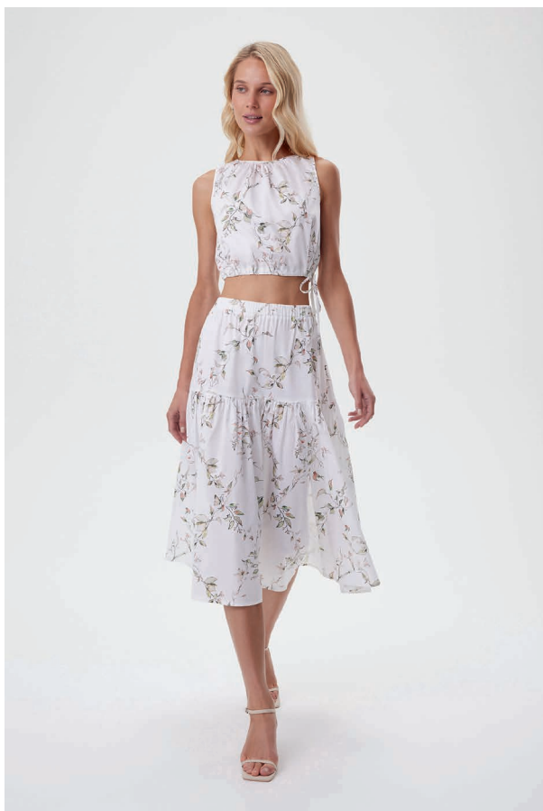
21-09-241 Укороченный топ «Флорариум» 21-09-244 Юбка «Флорариум»