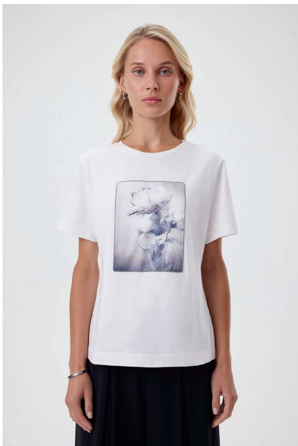
21-06-158 Футболка «Утренний полет» 21-06-159 Брюки с поясом «Тёплые ночи»