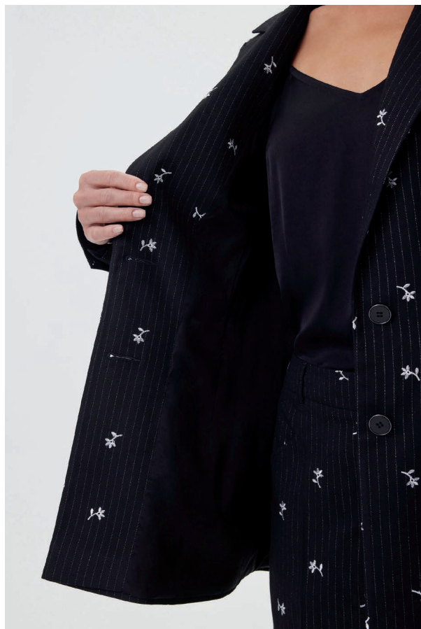
21-06-154 Жакет «Тёплые ночи» 21-06-166 Топ «Тёплые ночи» 21-06-155 Брюки «Тёплые ночи»