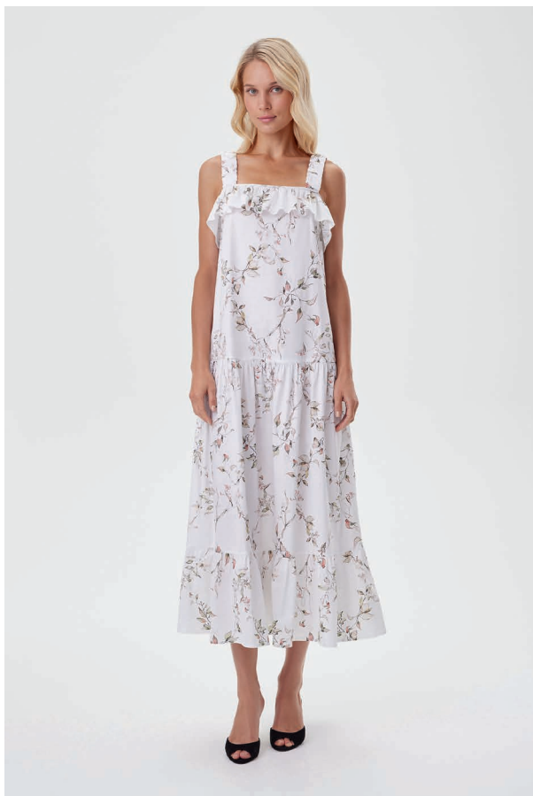
21-09-250 Сарафан «Флорариум»