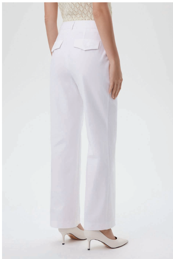
21-05-141 Топ «Солнечный взгляд» 21-05-144 Брюки белые