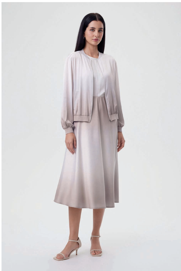
21-03-061 Блузон на молнии «Ритм большого города» 21-01-009 Топ молочный 21-03-089 Юбка «Ритм большого города»