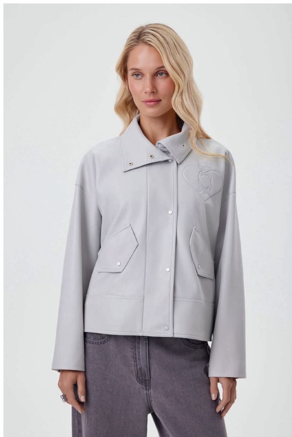
21-02-034 Куртка серая «Семейные ценности» 21-02-039 Брюки джинсовые серые