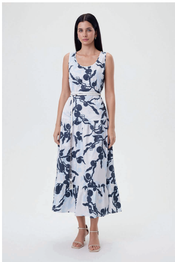
21-11-317 Сарафан «Вечерний сад»