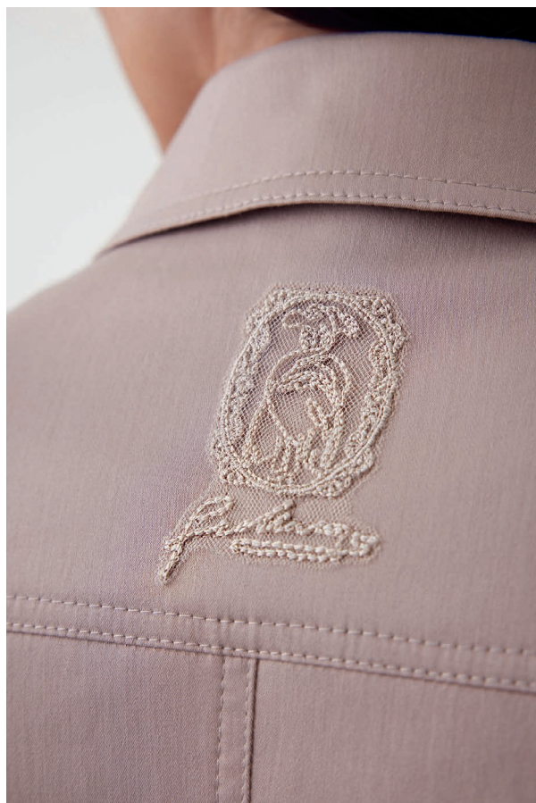
21-08-215 Платье с поясом «Оттенки миндаля»