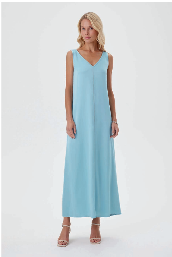
21-01-018 Платье без рукавов «Лазурная прогулка»