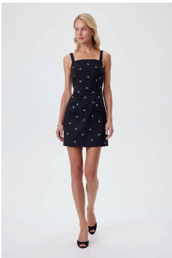
21-06-153 Платье прямое «Тёплые ночи»