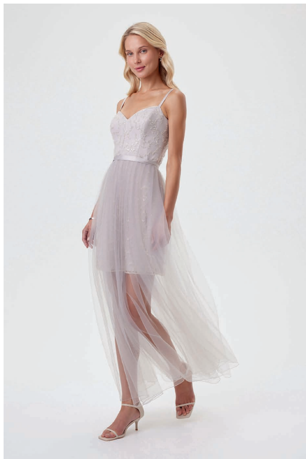
21-11-319 Платье со съёмной юбкой «Лунная вуаль»