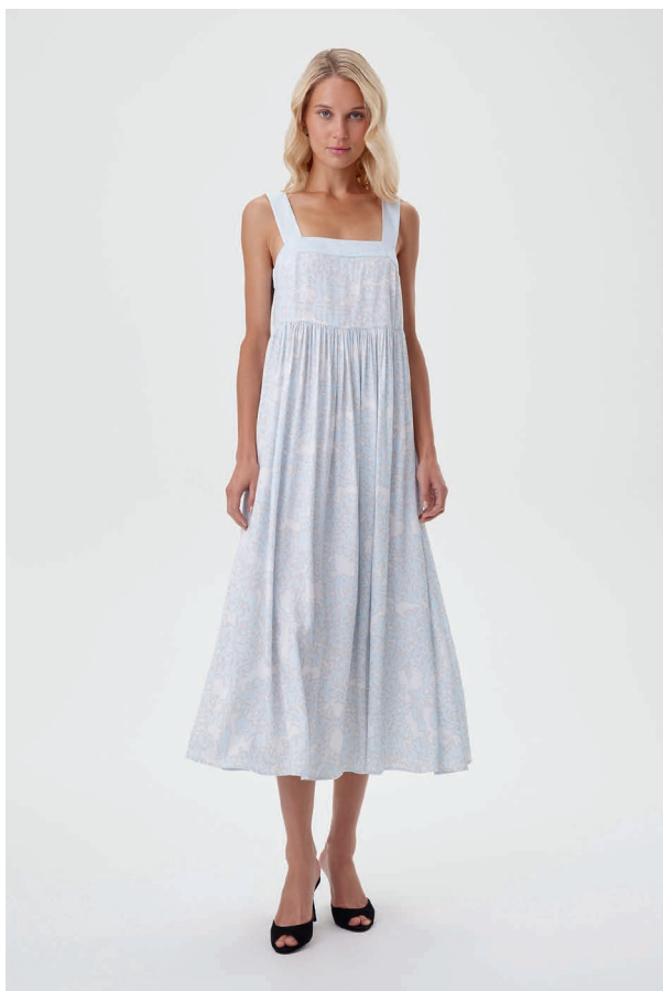
21-11-309 Сарафан «Летние истории»