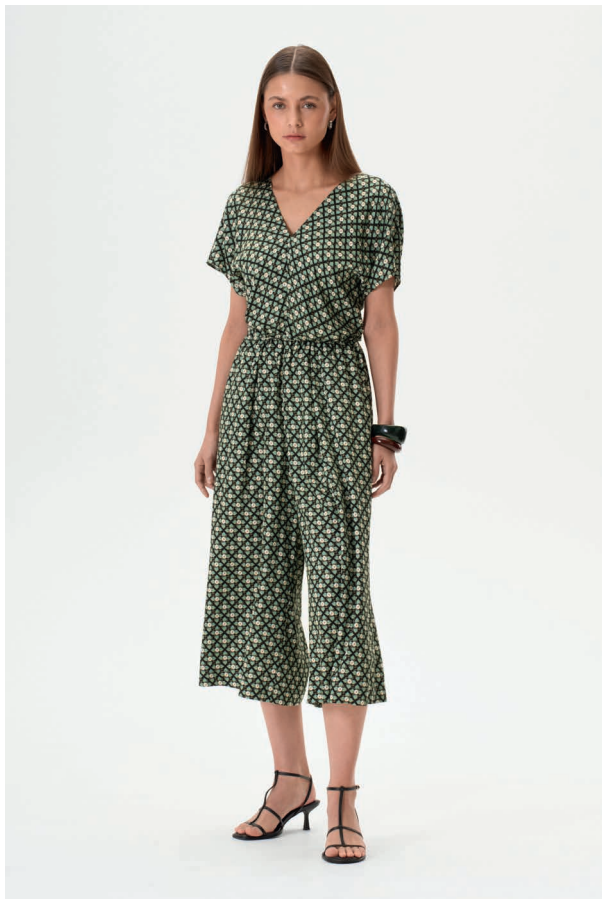
21-09-267 Комбинезон «Витраж»