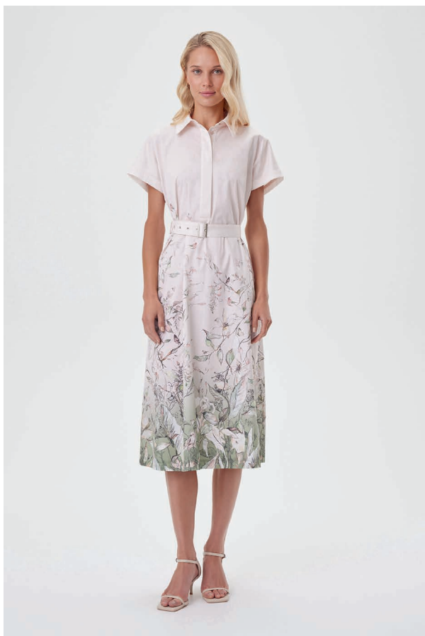
21-09-253 Платье с поясом «Флорариум»