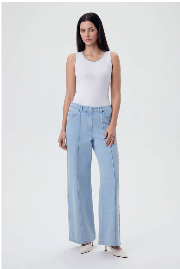
21-03-065 Топ вязаный белый 21-03-069 Брюки джинсовые «Городской полдень»