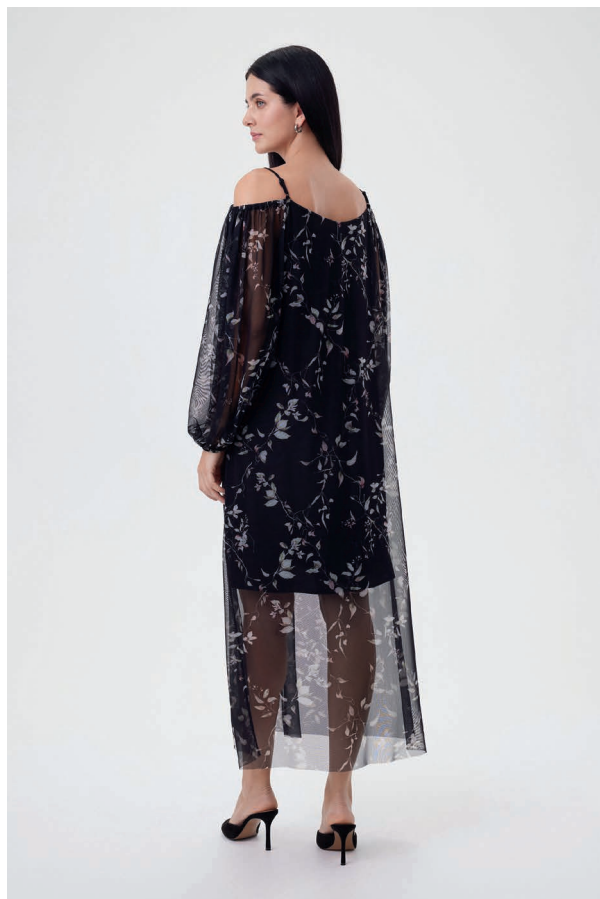
21-09-254 Платье «Летний вечер» 07-01-058 Пояс коса черный