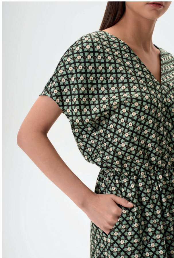
21-09-267 Комбинезон «Витраж»