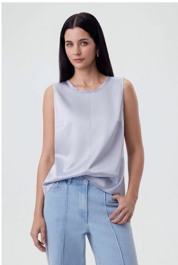
21-03-067 Топ серебряный 21-03-069 Брюки джинсовые «Городской полдень»