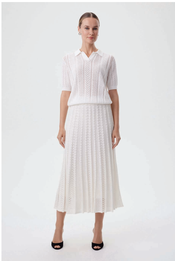
21-06-150 Джемпер поло «Утренний полет» 21-06-151 Юбка «Утренний полет»