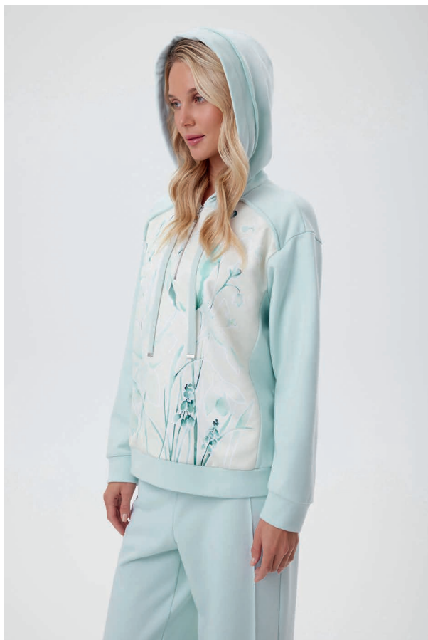
21-05-124 Худи «Первоцветы» 21-05-128 Брюки «Первоцветы»