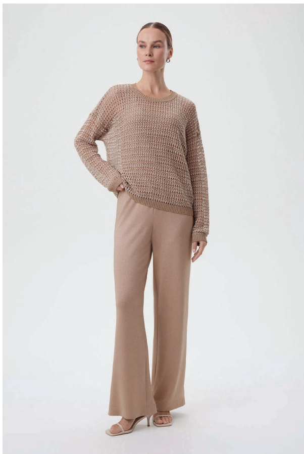
21-03-085 Джемпер «Ритм большого города» 21-09-261 Брюки «Золотая дюна»