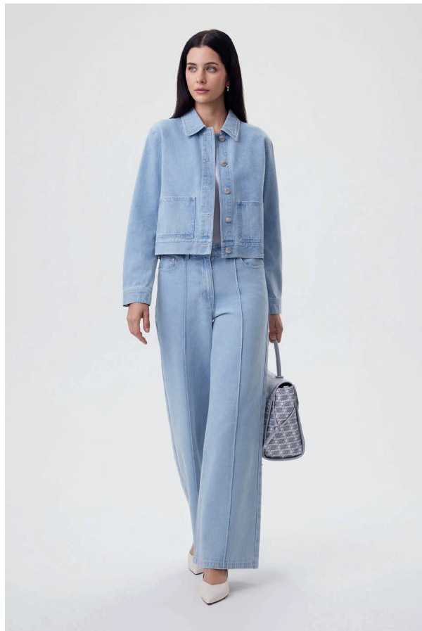
21-03-060 Куртка джинсовая «Городской полдень» 21-03-065 Топ вязаный белый 21-03-069 Брюки джинсовые «Городской полдень» 06-01-002 Сумка «Ритмы улиц»