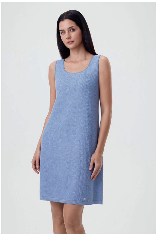
21-03-082 Платье вязаное «Городской полдень»