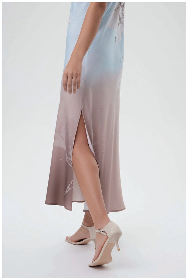
21-07-192 Платье «Осязание»