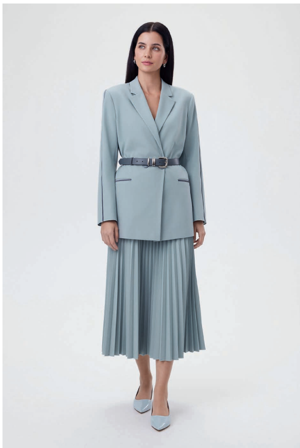
21-04-091 Жакет «Триумфальные аллеи» 21-04-093 Юбка «Триумфальные аллеи» 07-01-066 Пояс АВ синий 2,5 см