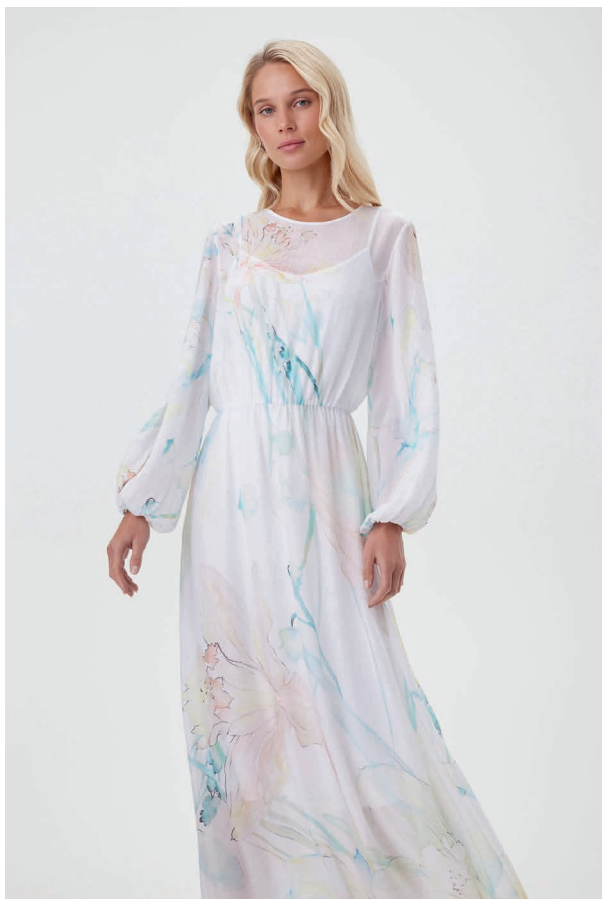
21-05-133 Платье «Первоцветы»