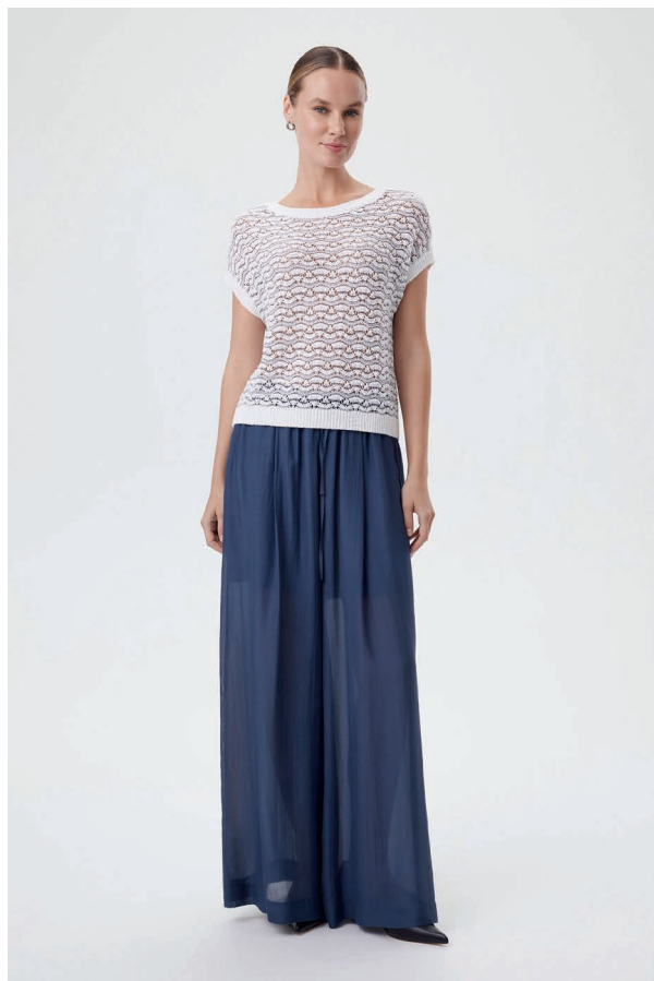
21-11-302 Джемпер «Летние истории» 21-11-305 Брюки «Лунный сапфир»