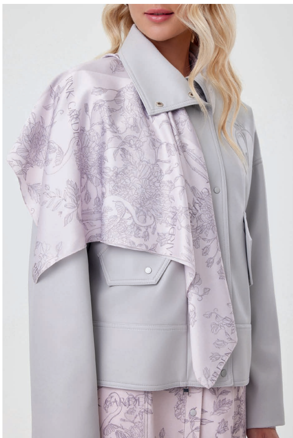
21-02-034 Куртка серая «Семейные ценности» 21-02-043 Платье с поясом «Розовые мечты» 21-02-048 Платок «Розовые мечты»