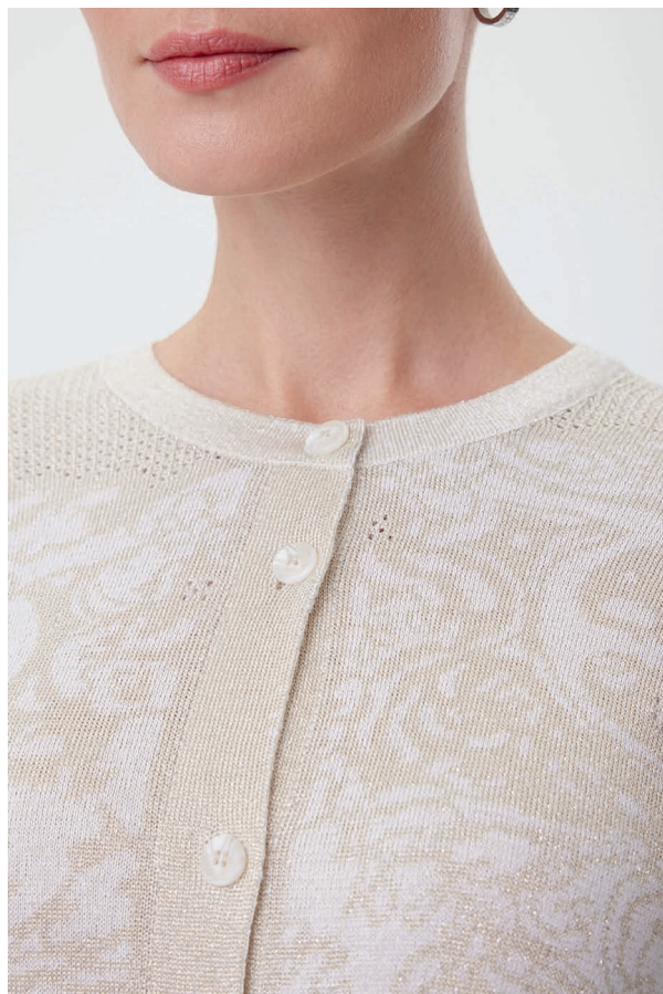
21-04-102 Джемпер «Триумфальные аллеи»