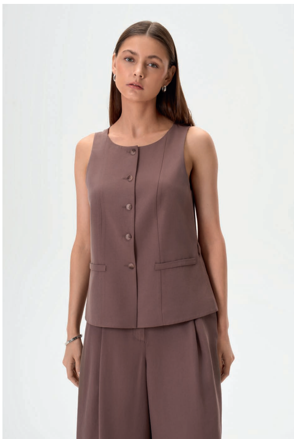
21-07-200 Жилет шоколадный 21-07-202 Шорты шоколадные