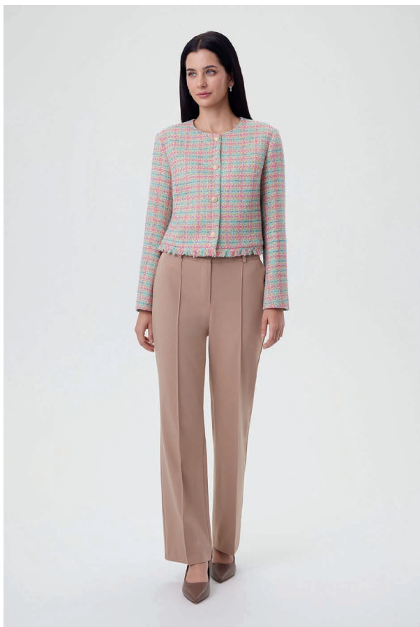
21-01-002 Жакет «Золотой витраж» 21-01-021 Брюки «Жемчужный мускат»