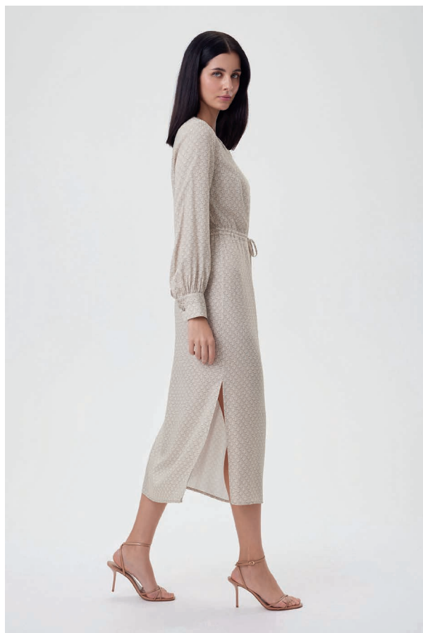
21-04-109 Платье «Жемчужный мускат»