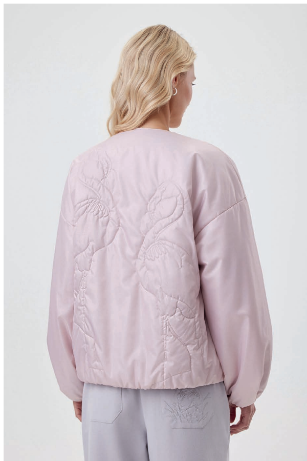
21-02-030 Куртка «Розовые мечты» 21-02-041 Брюки «Променад»