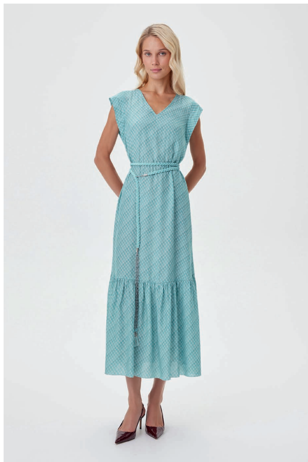
21-05-143 Платье «Лагуна» 07-01-059 Пояс коса бирюзовый