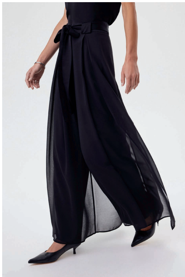
21-06-166 Топ «Тёплые ночи» 21-06-159 Брюки с поясом «Тёплые ночи»