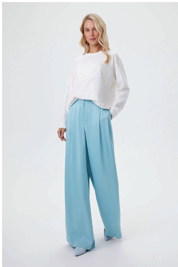
21-01-005 Свитшот «Жемчужный мускат» 21-01-011 Брюки «Лазурная прогулка»