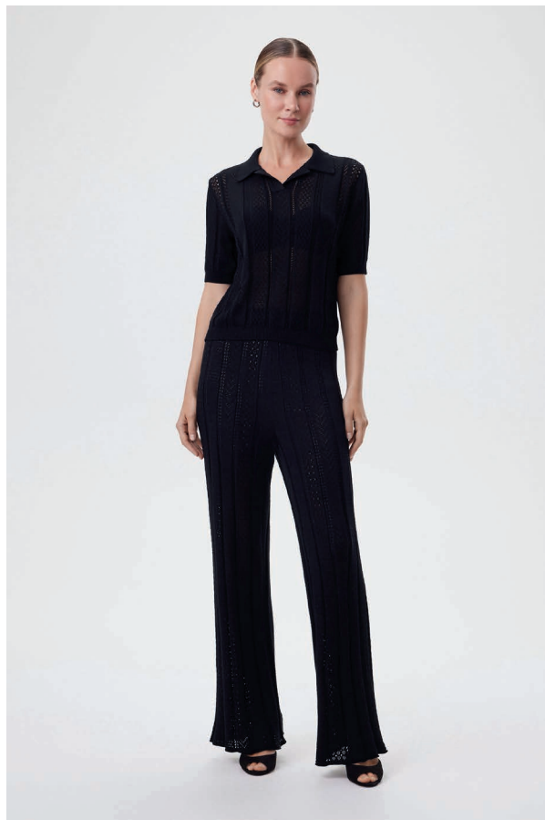
21-06-162 Джемпер поло «Тёплые ночи» 21-06-163 Брюки вязаные «Тёплые ночи»