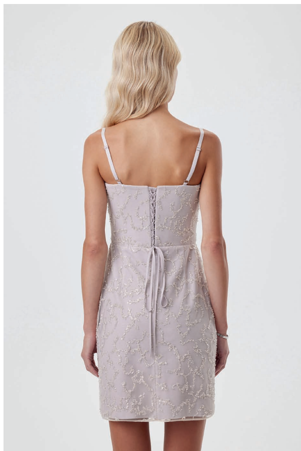
21-11-319 Платье со съёмной юбкой «Лунная вуаль»