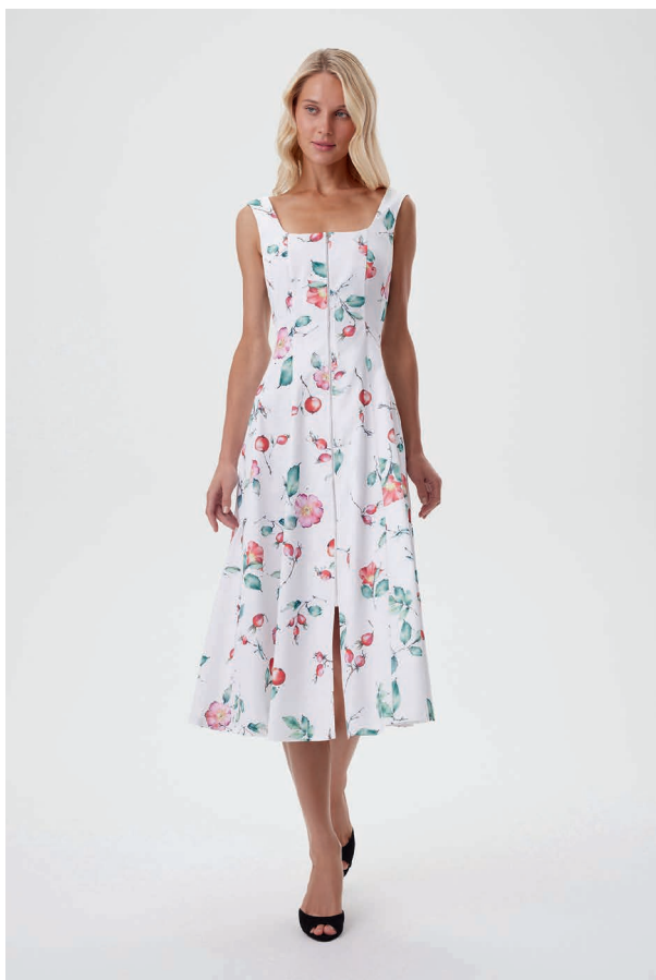
21-10-274 Сарафан «Эдем»