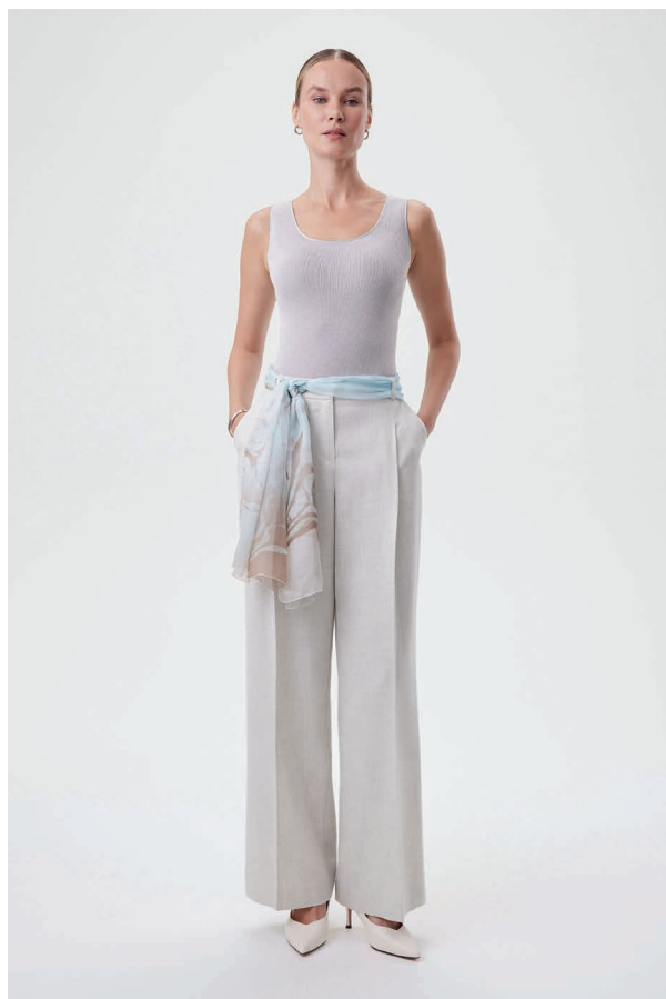
21-07-185 Топ вязаный «Осязание» 21-07-189 Брюки «Осязание» 21-07-198 Палантин «Осязание»