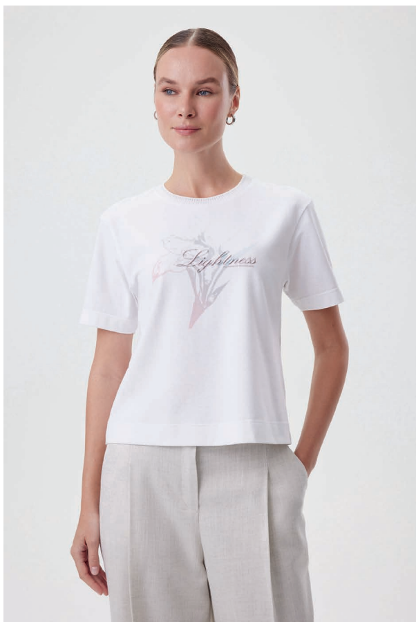
21-07-193 Футболка «Осязание» 21-07-189 Брюки «Осязание»