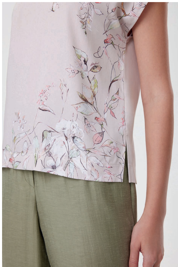
21-09-245 Блузка «Флорариум» 21-09-242 Брюки «Олива»