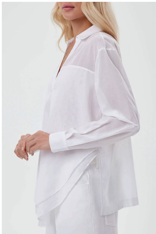
21-05-122 Блузка «Капель» 21-05-129 Брюки джинсовые «Капель»