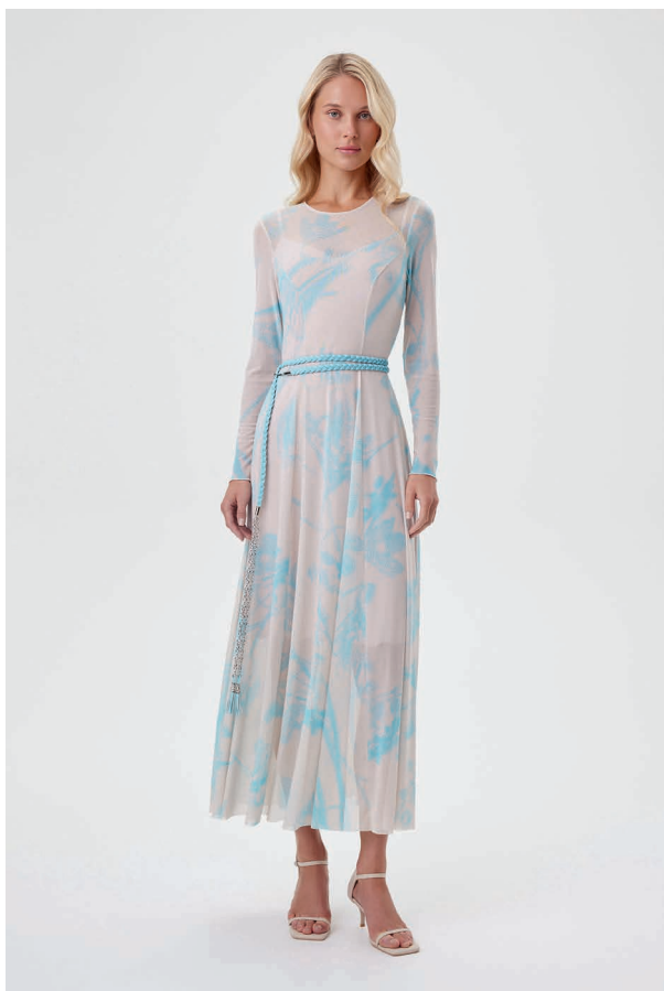
21-01-019 Платье «Весенний бутон» 07-01-059 Пояс коса бирюзовый