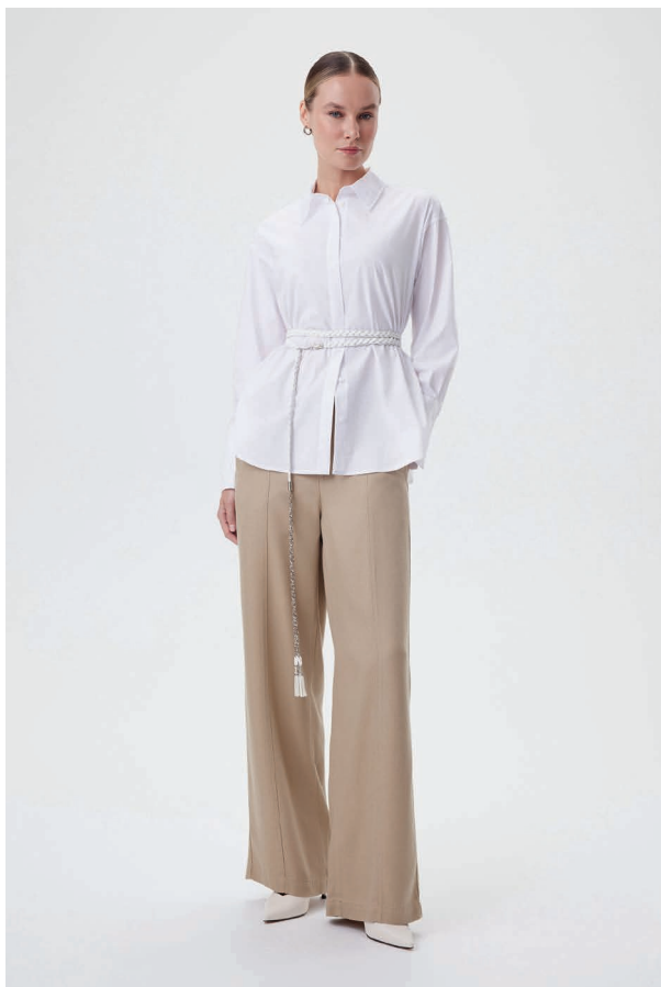
21-04-096 Блузка «Соната» 21-04-098 Брюки «Дуэт» 07-01-060 Пояс коса белый