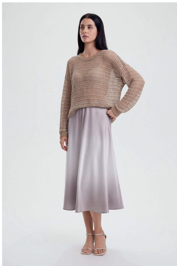
21-03-085 Джемпер «Ритм большого города» 21-03-089 Юбка «Ритм большого города»