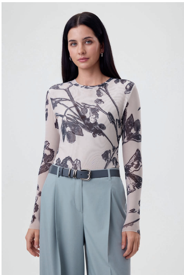
21-04-108 Джемпер «Силуэт весны» 21-04-092 Брюки широкие «Триумфальные аллеи» 07-01-066 Пояс АВ синий 2,5 см