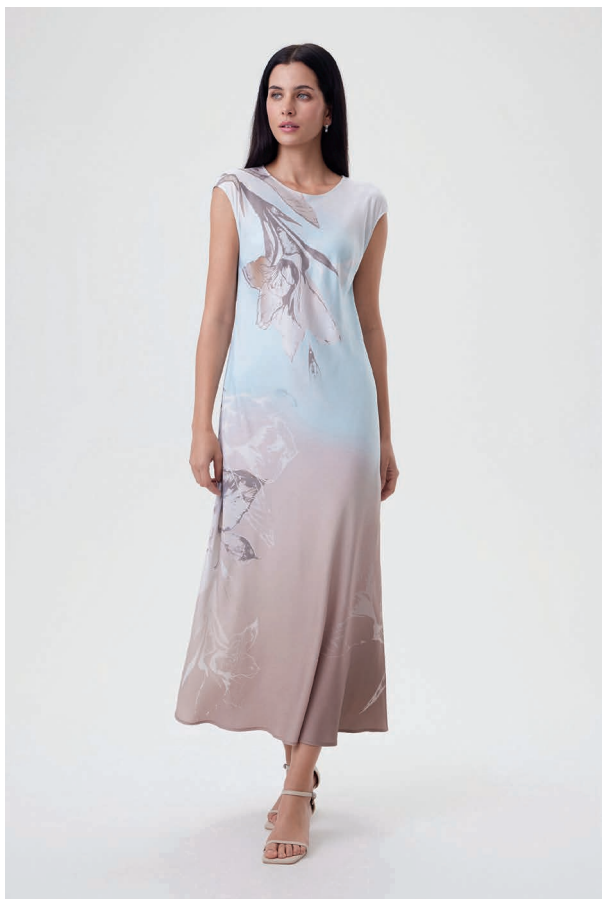
21-07-192 Платье «Осязание»