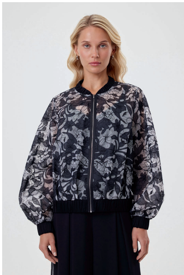
21-06-156 Блузон на молнии «Тёплые ночи» 21-06-159 Брюки с поясом «Тёплые ночи»