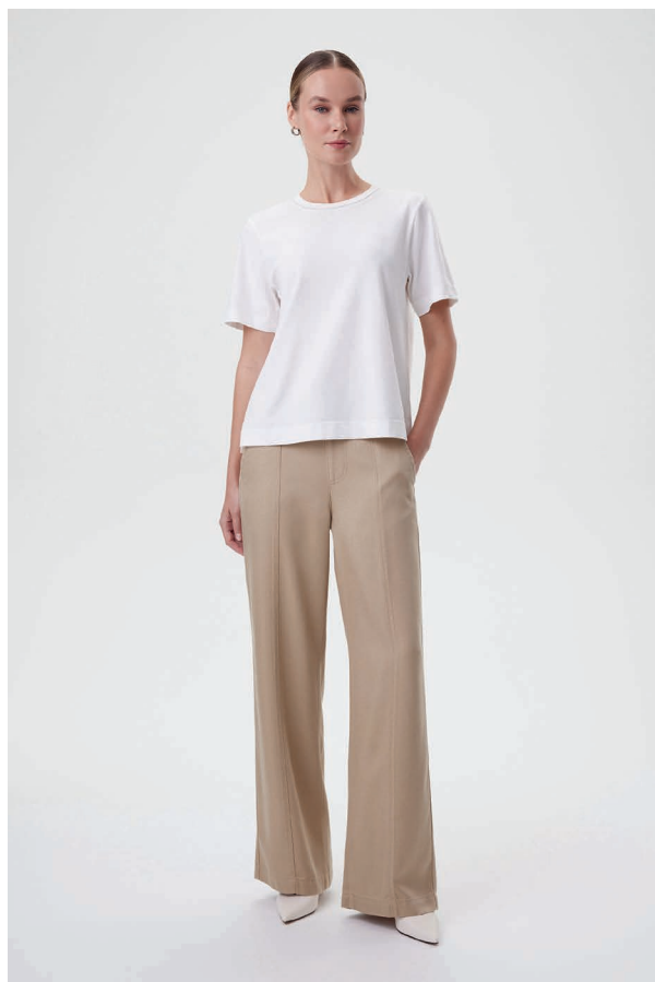
21-04-100 Футболка «Триумфальные аллеи» 21-04-098 Брюки «Дуэт»