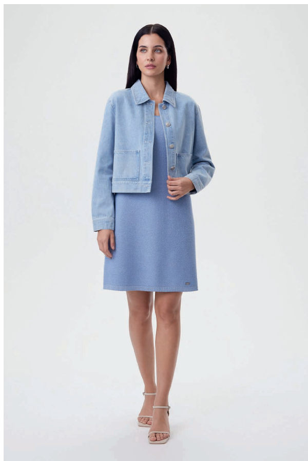
21-03-060 Куртка джинсовая «Городской полдень» 21-03-082 Платье вязаное «Городской полдень»