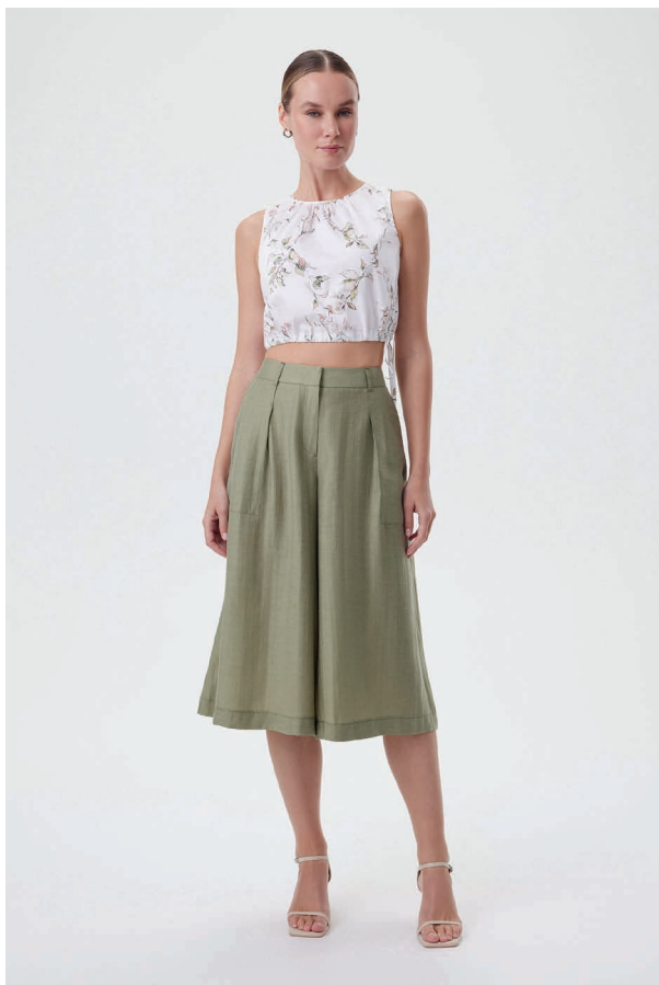
21-09-241 Укороченный топ «Флорариум» 21-09-248 Шорты «Олива»