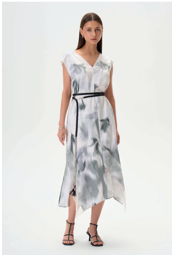
21-09-266 Платье «Силуэты сада» 07-01-058 Пояс коса черный