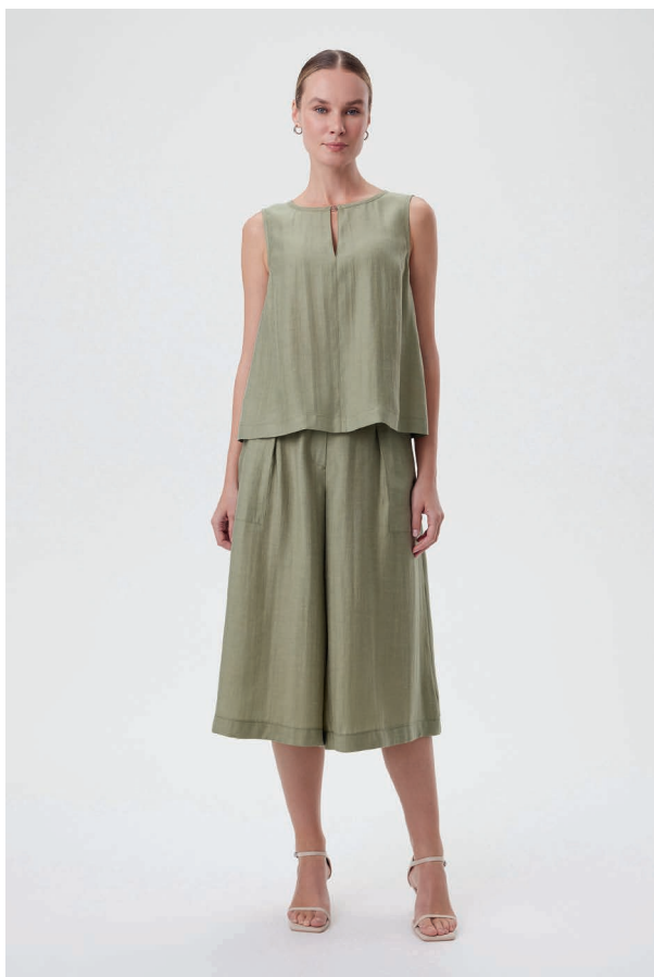
21-09-257 Топ «Олива» 21-09-248 Шорты «Олива»