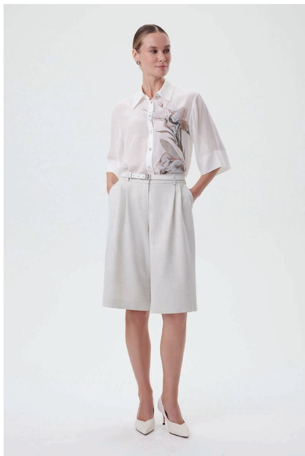
21-07-183 Блузка «Осязание» 21-07-195 Шорты «Осязание» 07-01-061 Пояс АВ «88» белый 2 см