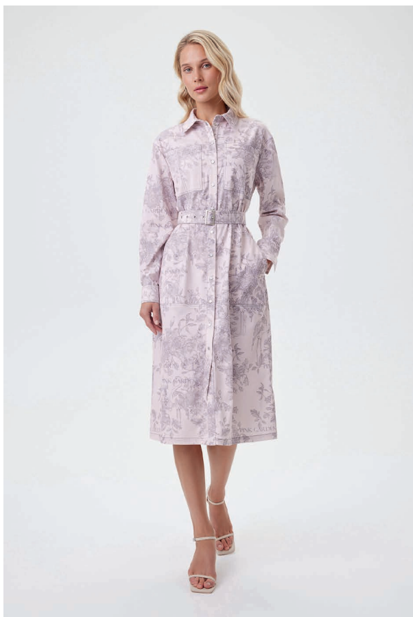
21-02-043 Платье с поясом «Розовые мечты»