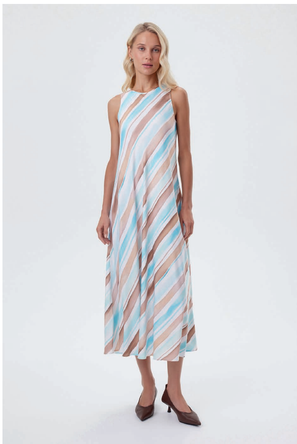
21-05-132 Платье «Солнечный взгляд»