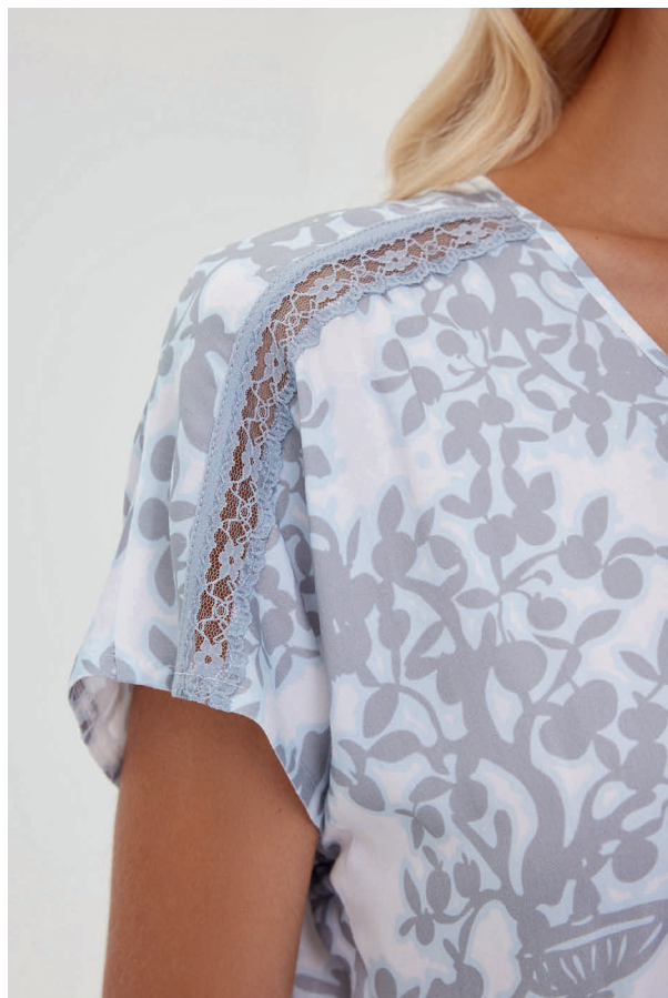
21-11-318 Платье «Летние истории»