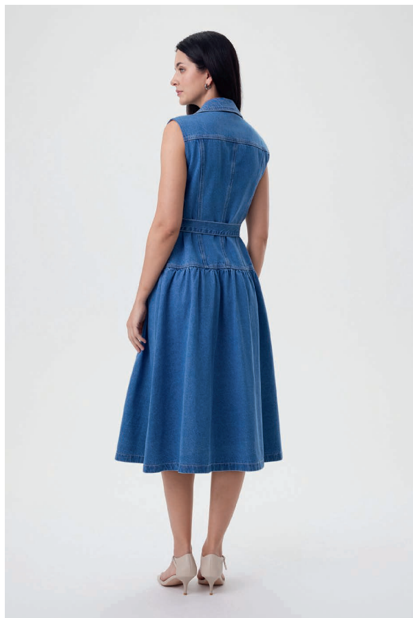
21-03-071 Платье джинсовое с поясом «Городской полдень»