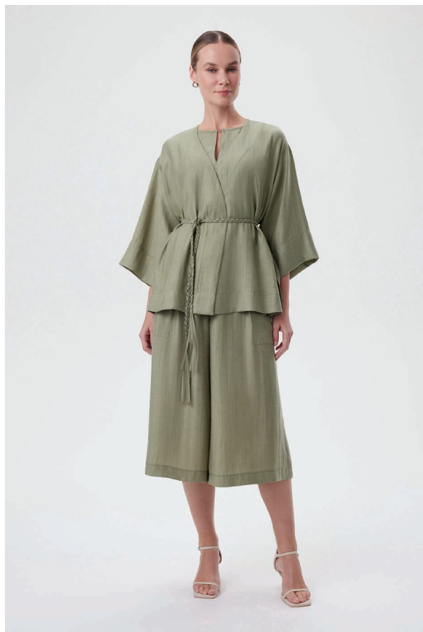
21-09-240 Жакет с поясом «Олива» 21-09-248 Шорты «Олива»