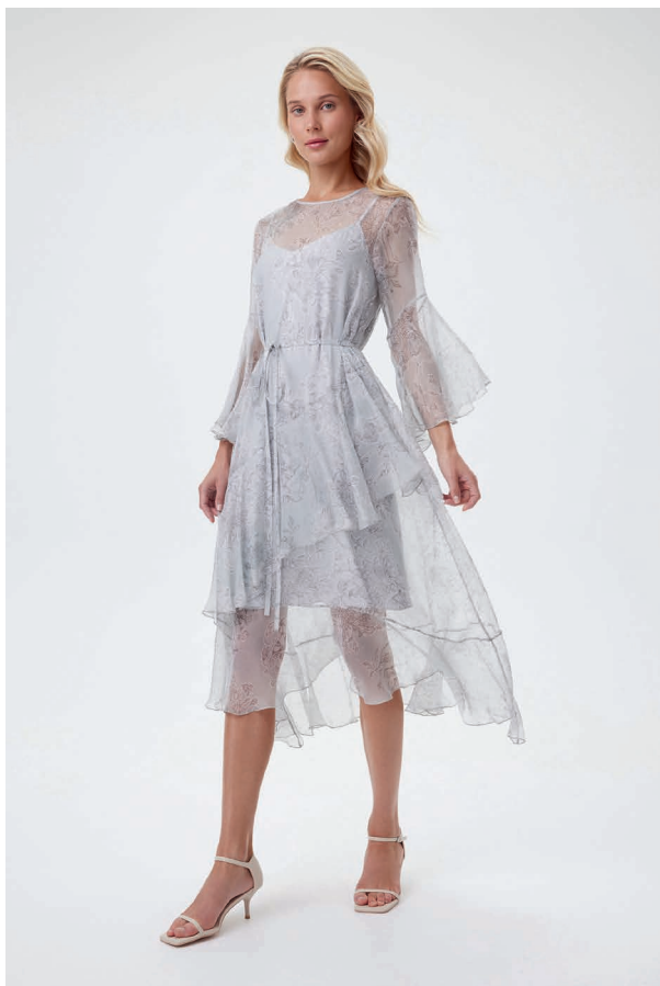
21-02-033 Платье с поясом «Небесная симфония»