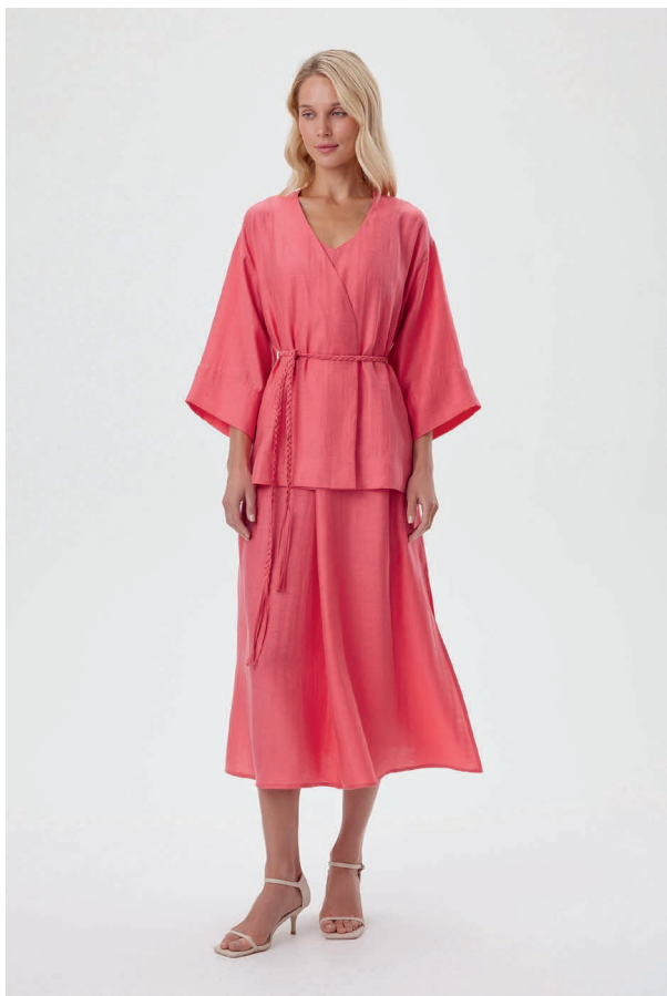
21-10-280 Жакет с поясом «Вкус лета» 21-10-273 Платье «Вкус лета»