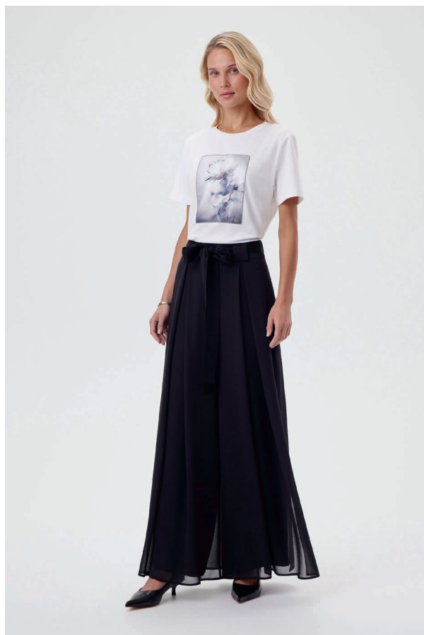
21-06-158 Футболка «Утренний полет» 21-06-159 Брюки с поясом «Тёплые ночи»