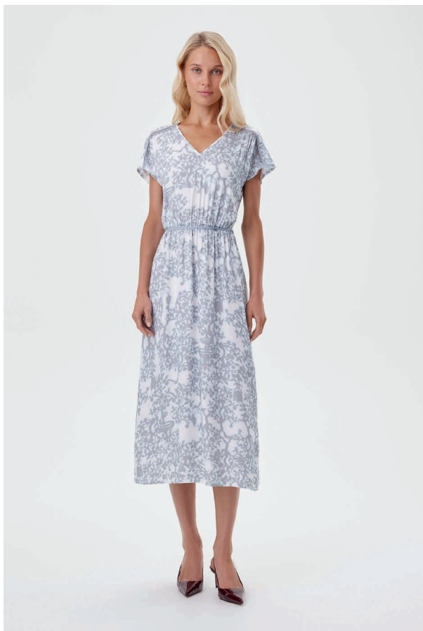
21-11-318 Платье «Летние истории»