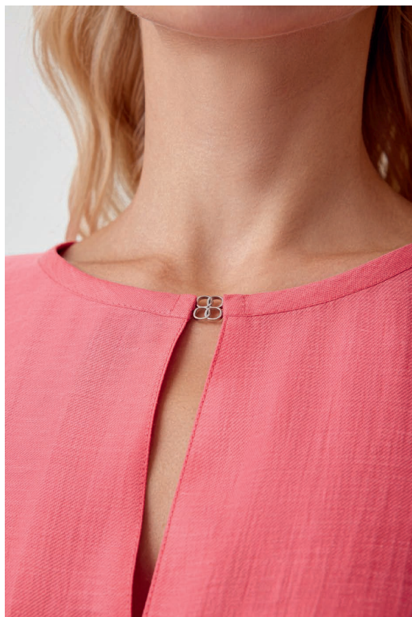
21-10-271 Топ «Вкус лета»