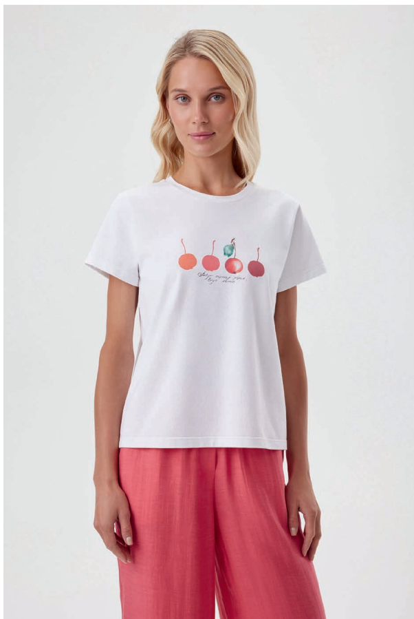
21-10-270 Футболка «Вкус лета» 21-10-272 Брюки «Вкус лета»