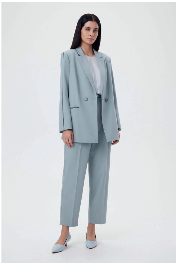
21-04-091 Жакет «Триумфальные аллеи» 21-04-101 Блузка «Триумфальные аллеи» 21-04-099 Брюки «Триумфальные аллеи»