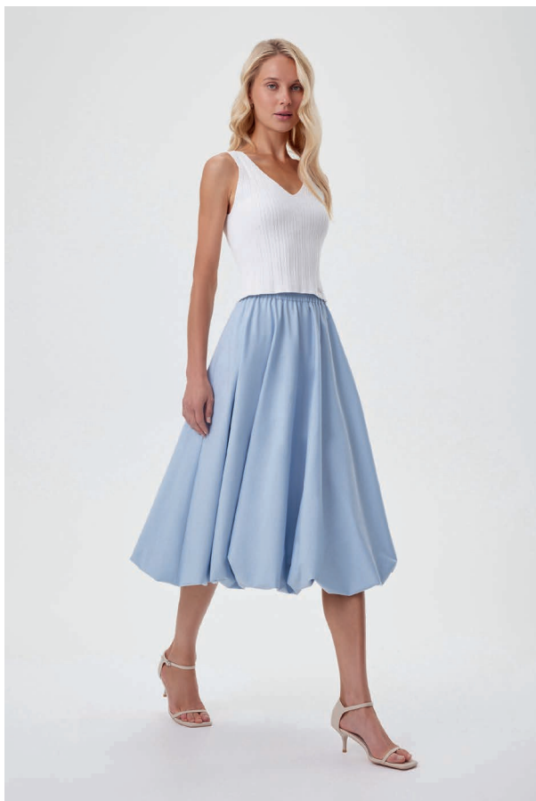
21-11-315 Топ вязаный «Летние истории» 21-11-307 Юбка «Летние истории»