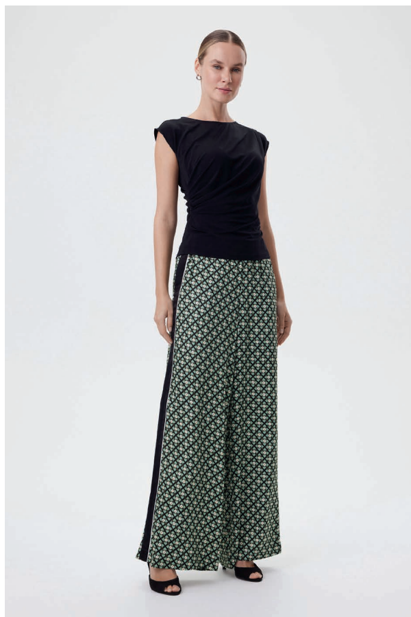
21-09-256 Блузка «Летний вечер» 21-09-247 Брюки «Витраж»