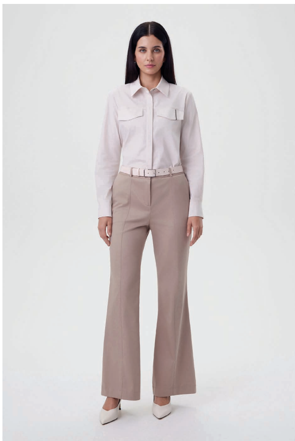
21-08-223 Блузка «Оттенки миндаля» 21-08-222 Брюки «Оттенки миндаля» 07-01-054 Пояс АВ пудровый 3 см