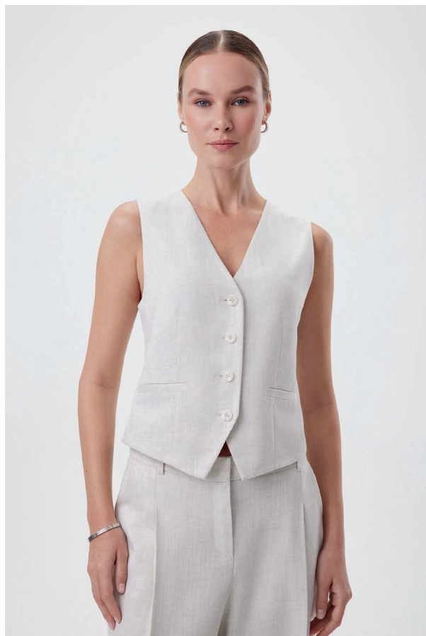
21-07-186 Жилет «Осязание» 21-07-189 Брюки «Осязание»