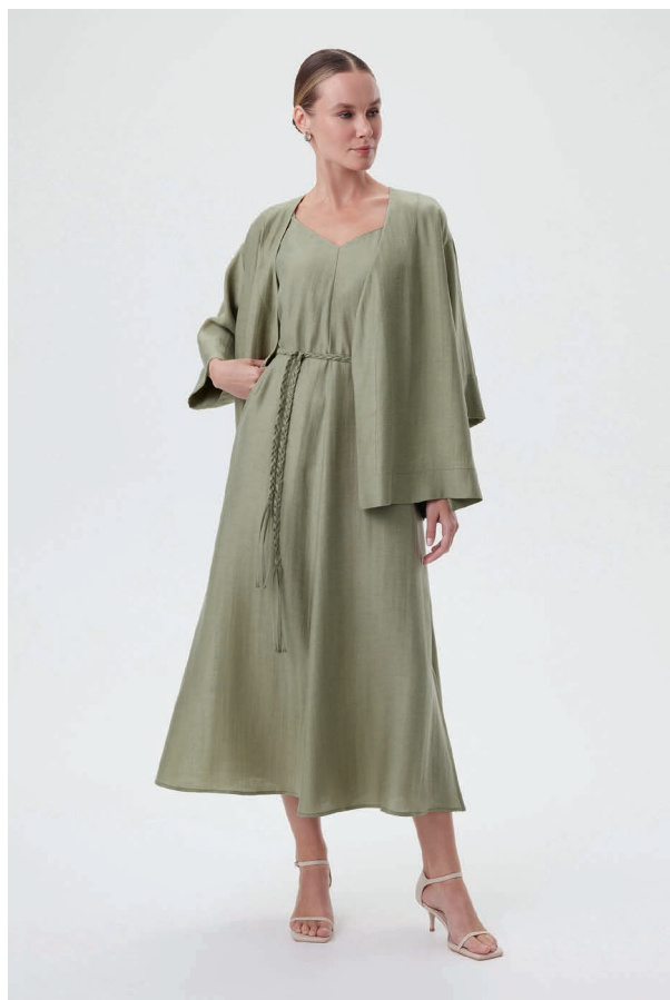
21-09-240 Жакет с поясом «Олива» 21-09-264 Платье «Олива»