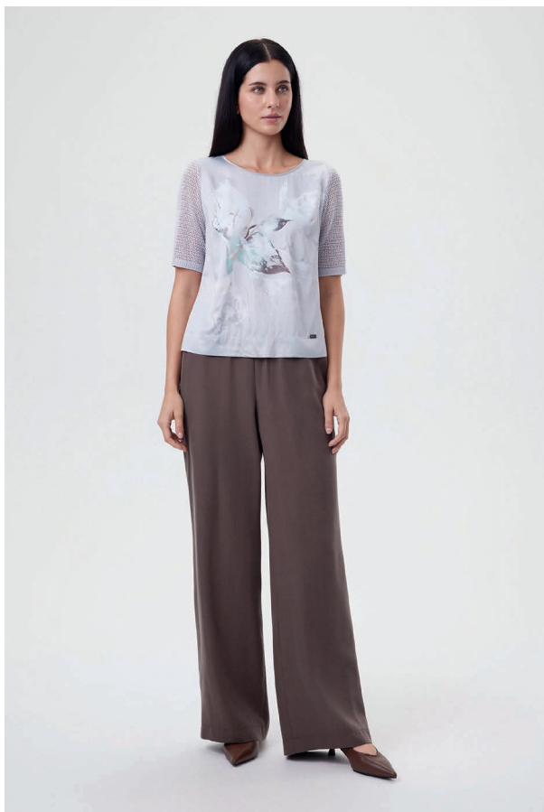
21-07-197 Джемпер «Осязание» 21-07-190 Брюки шоколадные