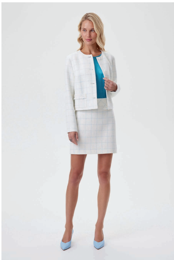
21-01-016 Жакет «Мартовский бриз» 21-01-017 Топ «Лазурная прогулка» 21-01-010 Юбка «Мартовский бриз»