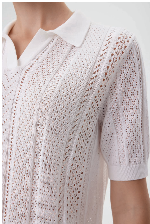
21-06-150 Джемпер поло «Утренний полет»