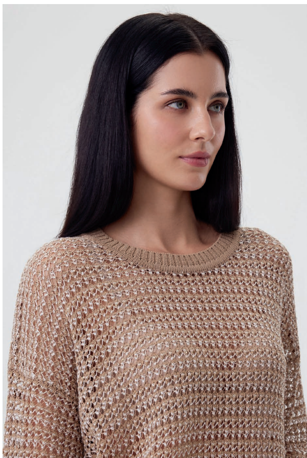
21-03-085 Джемпер «Ритм большого города»