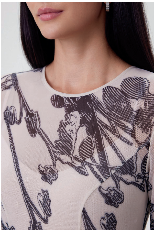
21-04-107 Платье «Силуэт весны»