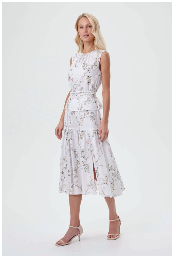
21-09-265 Топ «Флорариум» 21-09-244 Юбка «Флорариум» 07-01-060 Пояс коса белый