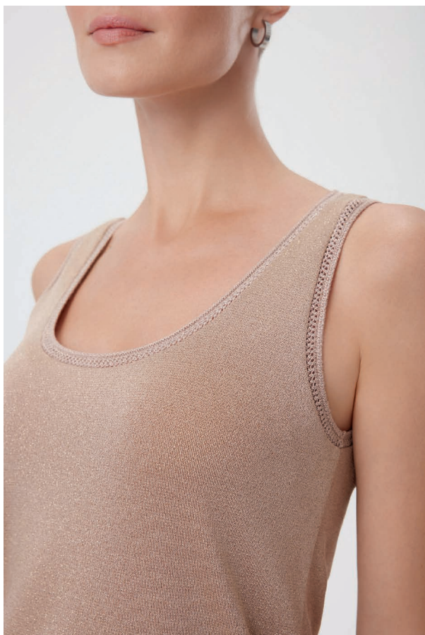
21-09-262 Топ «Золотая дюна»