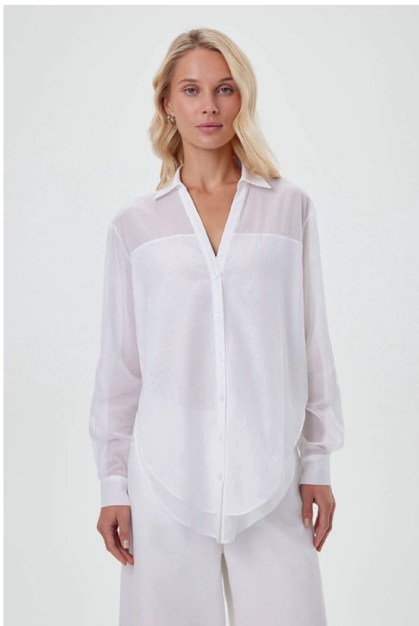
21-05-122 Блузка «Капель» 21-05-129 Брюки джинсовые «Капель»