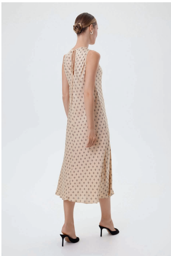
21-09-255 Платье «Витраж»