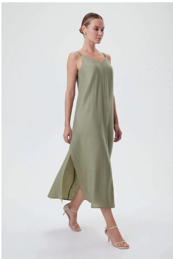
21-09-264 Платье «Олива»