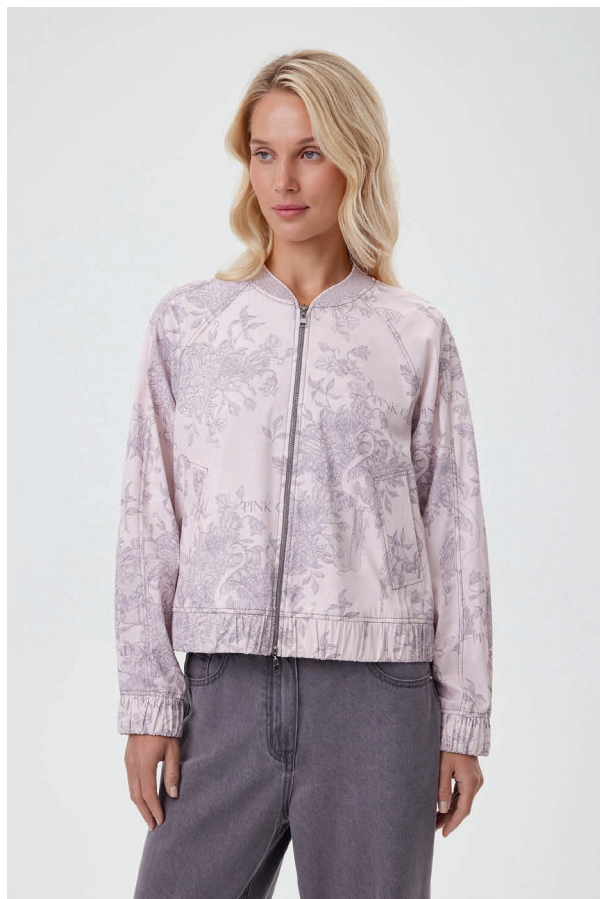
21-02-045 Блузон на молнии «Розовые мечты» 21-02-039 Брюки джинсовые серые