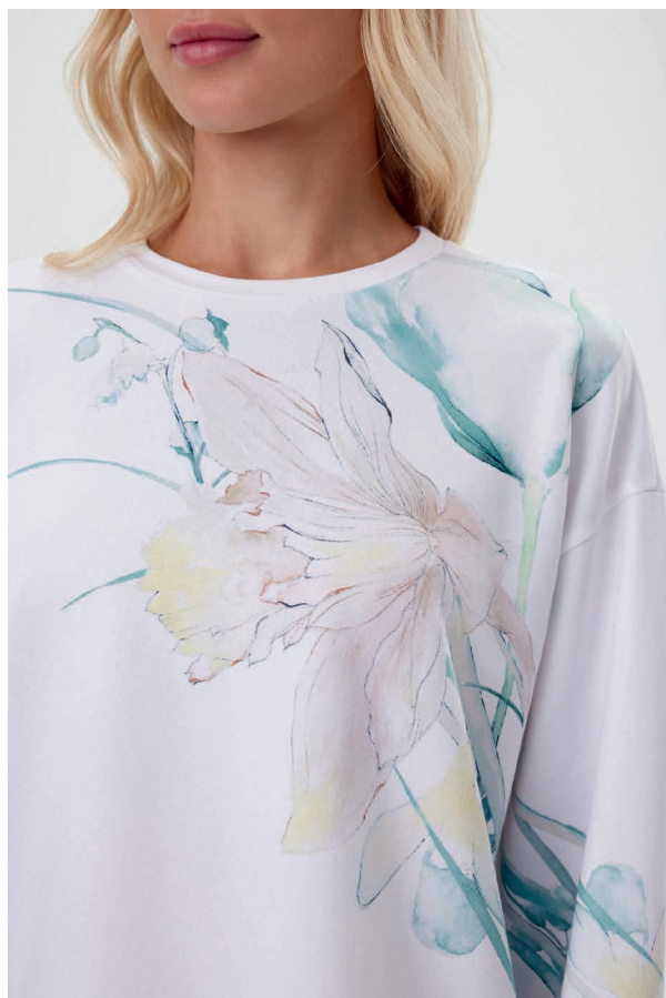
21-05-135 Свитшот «Первоцветы»