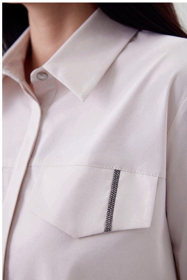
21-08-223 Блузка «Оттенки миндаля»