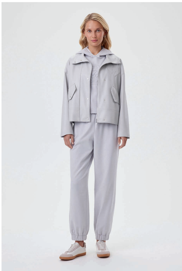
21-02-034 Куртка серая «Семейные ценности» 21-02-036 Худи «Променад» 21-02-041 Брюки «Променад»