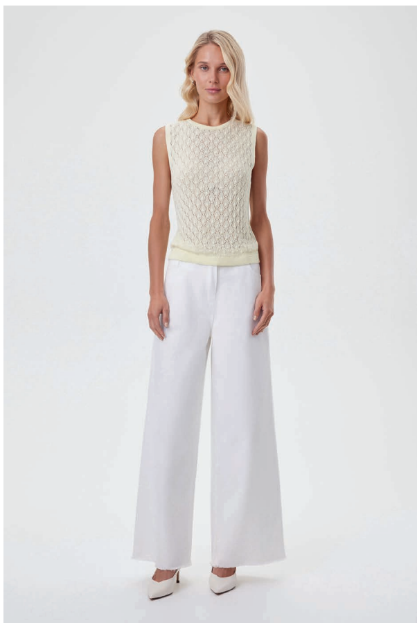
21-05-141 Топ «Солнечный взгляд» 21-05-129 Брюки джинсовые «Капель»