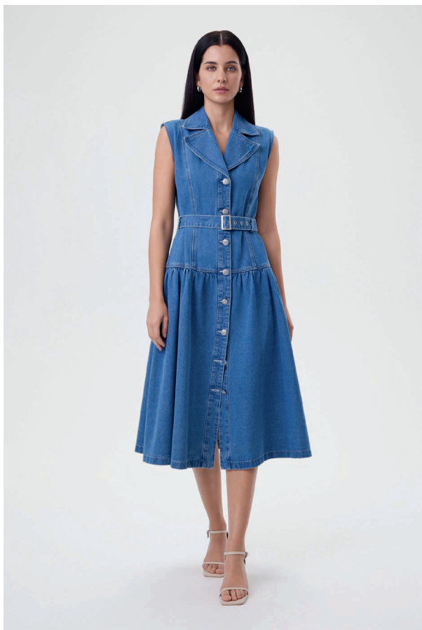
21-03-071 Платье джинсовое с поясом «Городской полдень»