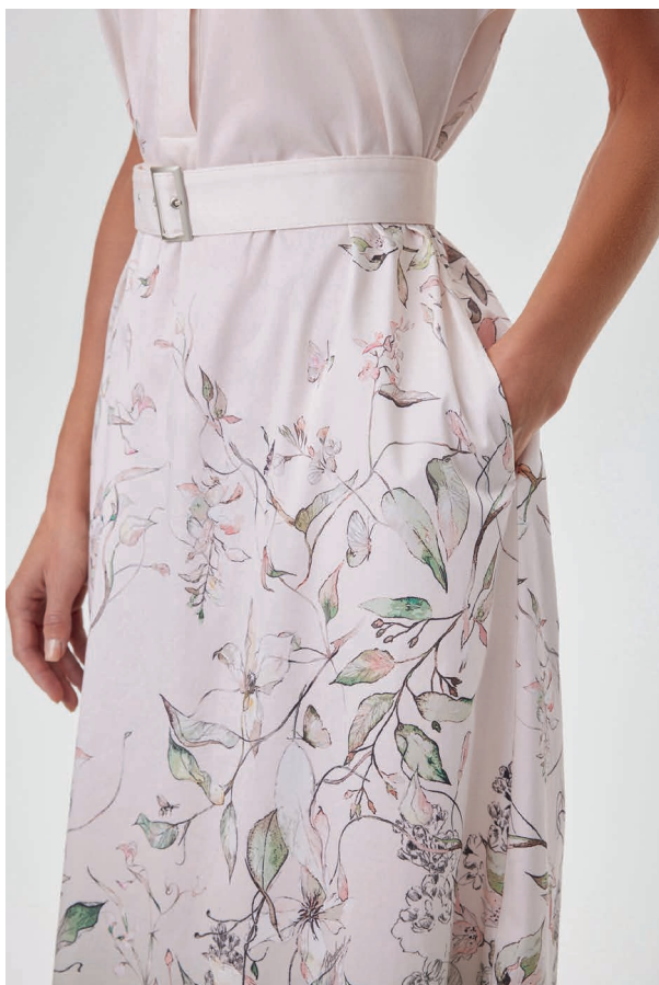
21-09-253 Платье с поясом «Флорариум»