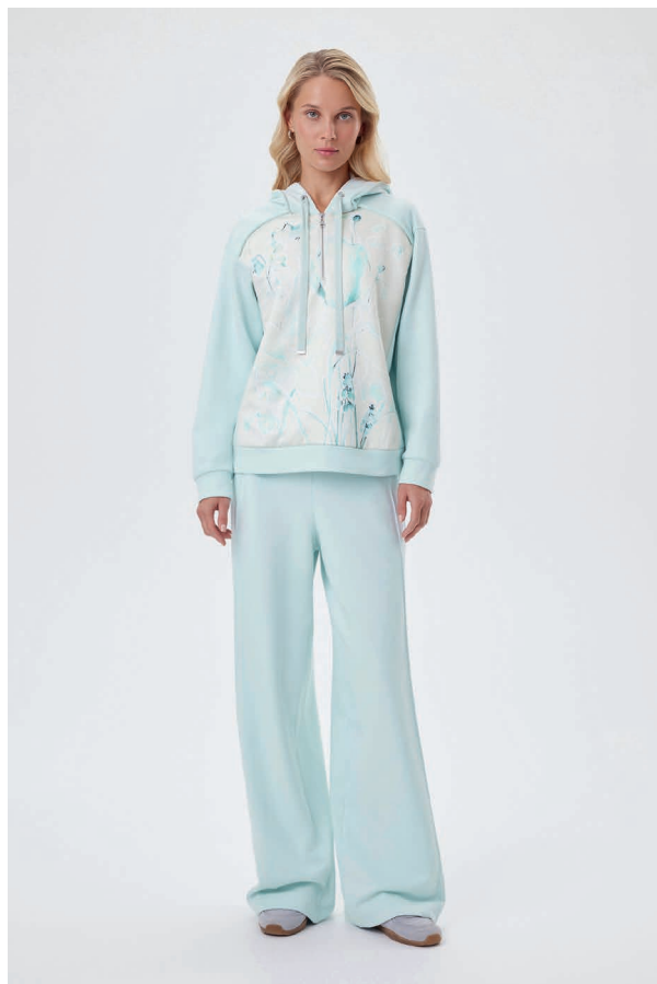
21-05-124 Худи «Первоцветы» 21-05-128 Брюки «Первоцветы»