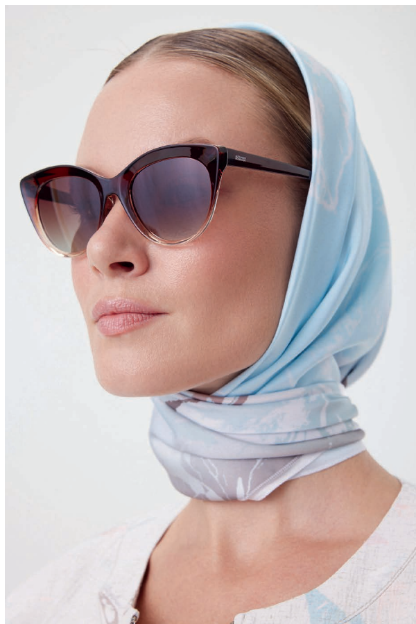
21-07-181 Блузон на молнии «Осязание» 09-01-021 Очки коричневые кошачий глаз с футляром 21-07-199 Платок «Осязание»