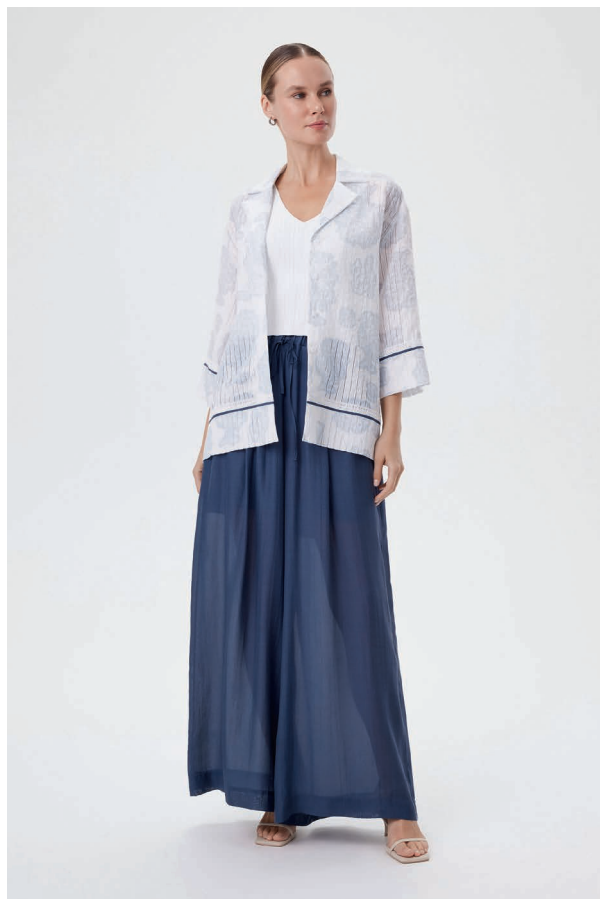
21-11-300 Блузка «Летние истории» 21-11-315 Топ вязаный «Летние истории» 21-11-305 Брюки «Лунный сапфир»