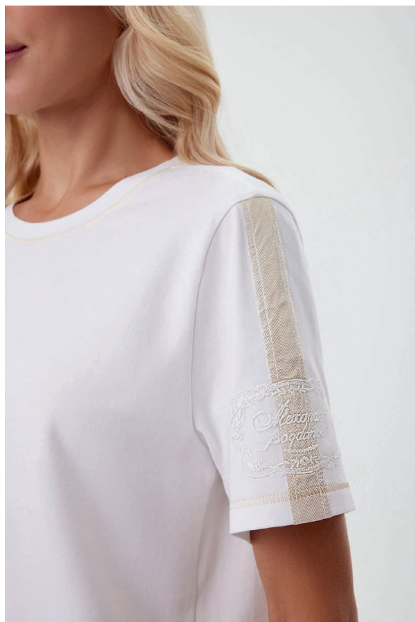
21-01-024 Футболка «Жемчужный мускат»