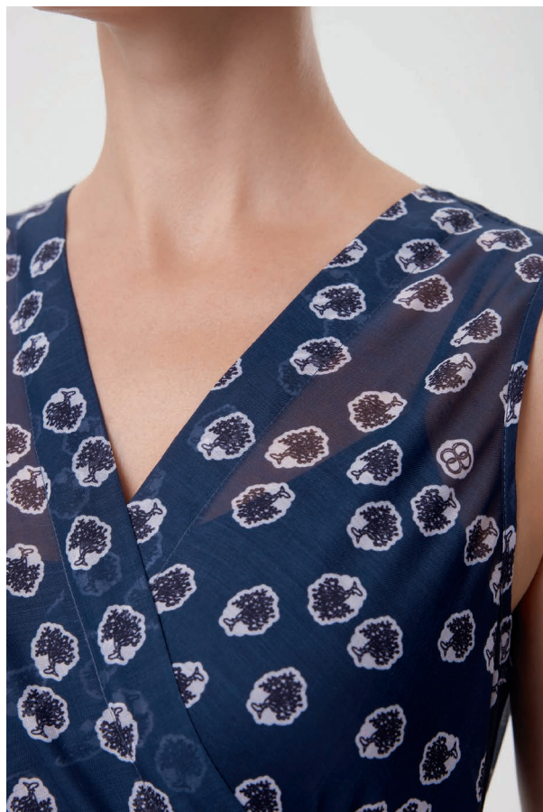
21-11-314 Платье «Вечерний сад»