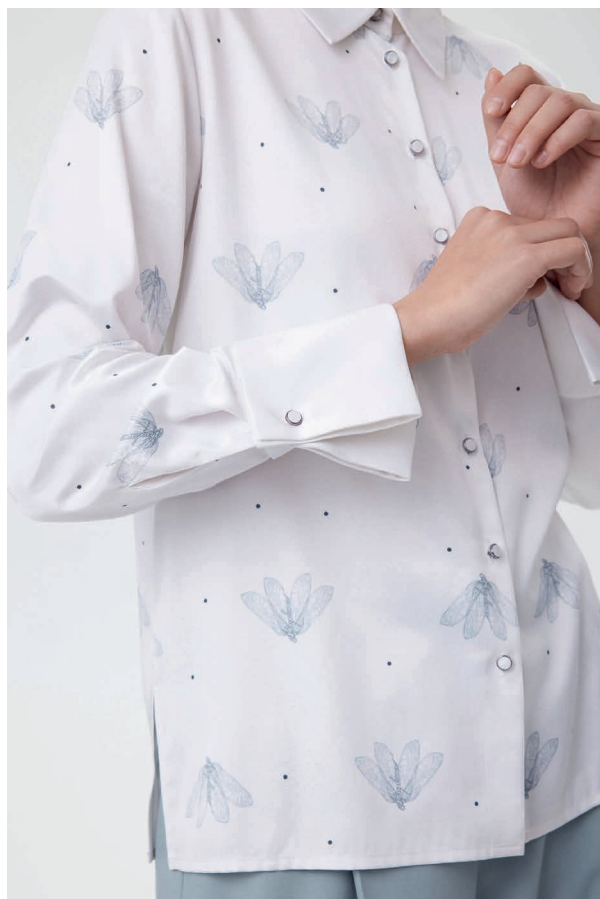
21-04-095 Блузка «Полёт» 21-04-092 Брюки широкие «Триумфальные аллеи»