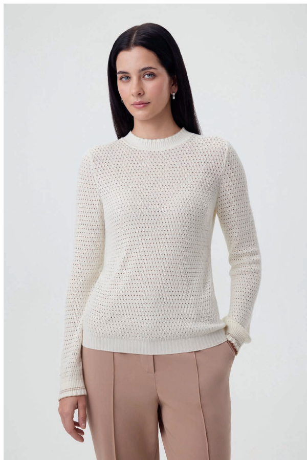
21-01-023 Джемпер «Жемчужный мускат» 21-01-021 Брюки «Жемчужный мускат»