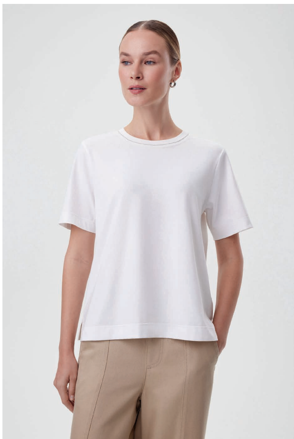
21-04-100 Футболка «Триумфальные аллеи» 21-04-098 Брюки «Дуэт»