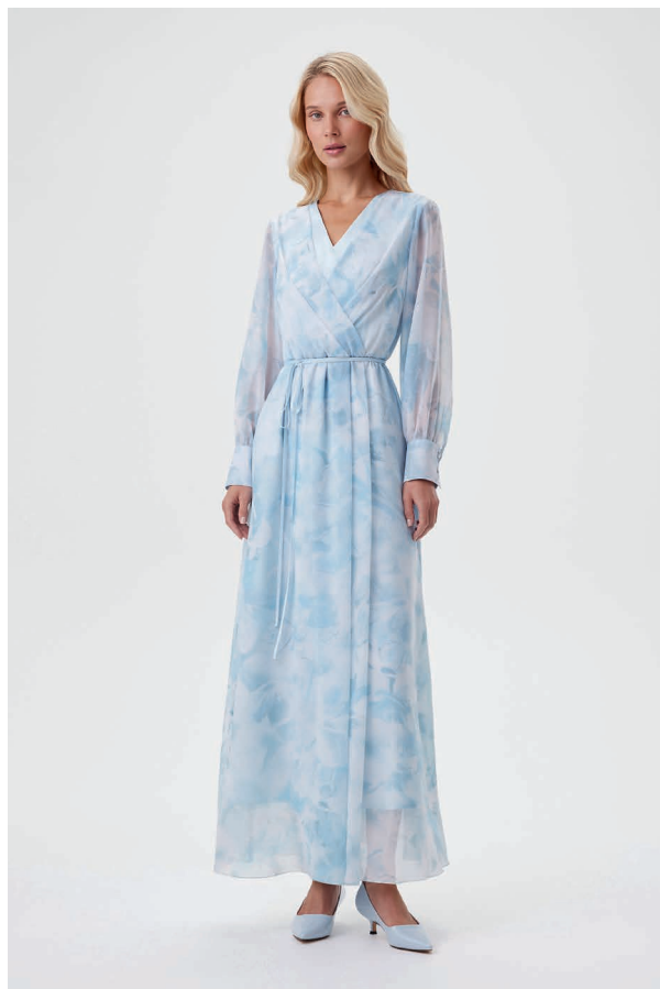
21-01-026 Платье «Дыхание облаков»