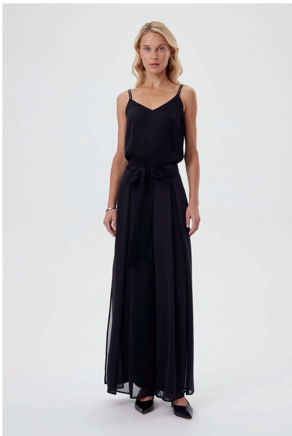
21-06-166 Топ «Тёплые ночи» 21-06-159 Брюки с поясом «Тёплые ночи»