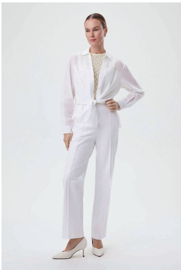
21-05-122 Блузка «Капель» 21-05-141 Топ «Солнечный взгляд» 21-05-144 Брюки белые