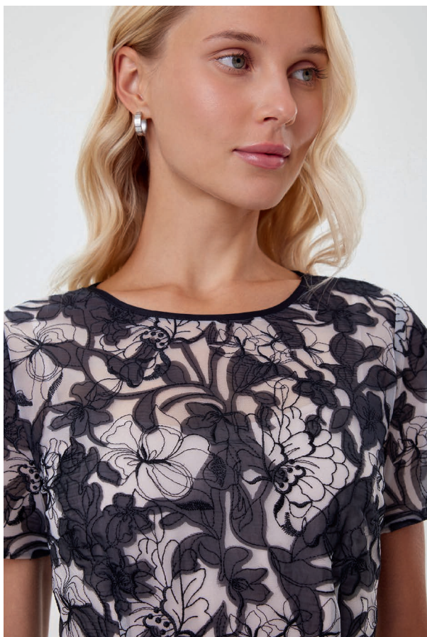
21-06-167 Платье «Тёплые ночи»