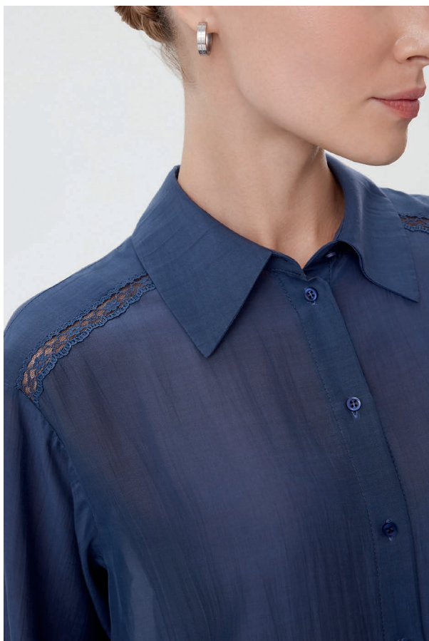
21-11-310 Блузка «Лунный сапфир»