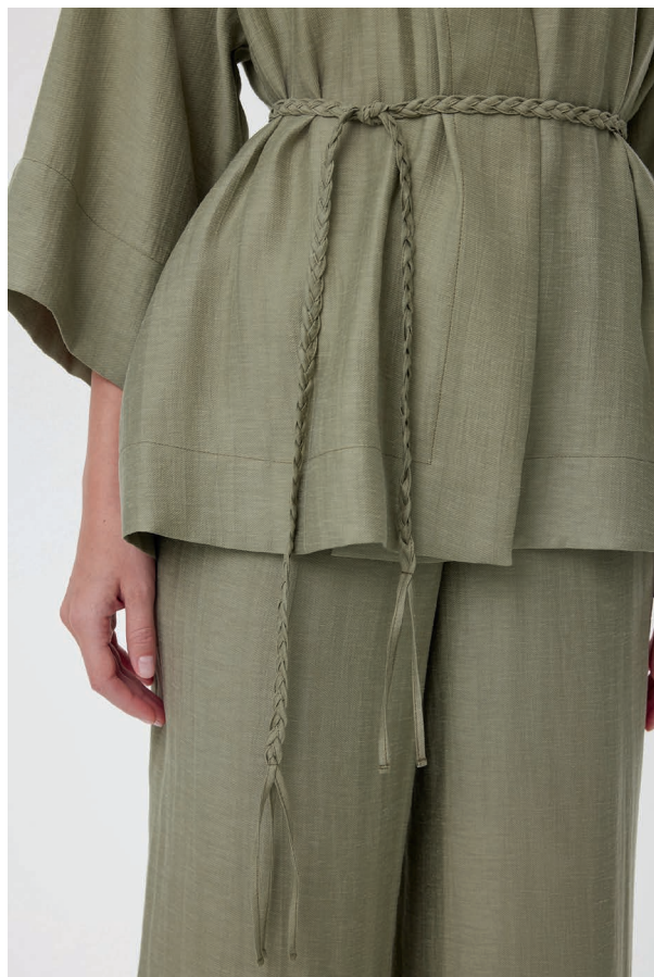
21-09-240 Жакет с поясом «Олива» 21-09-242 Брюки «Олива»