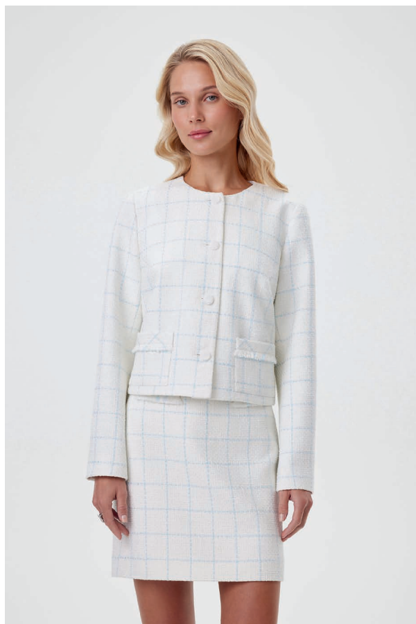
21-01-016 Жакет «Мартовский бриз» 21-01-010 Юбка «Мартовский бриз»