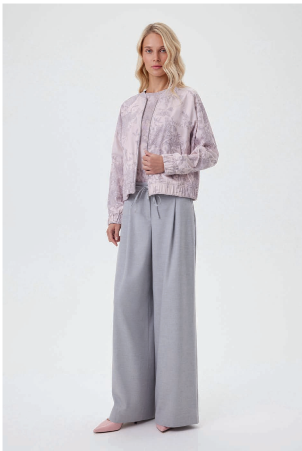
21-02-045 Блузон на молнии «Розовые мечты» 21-02-037 Джемпер «Розовые мечты» 21-02-047 Брюки серые