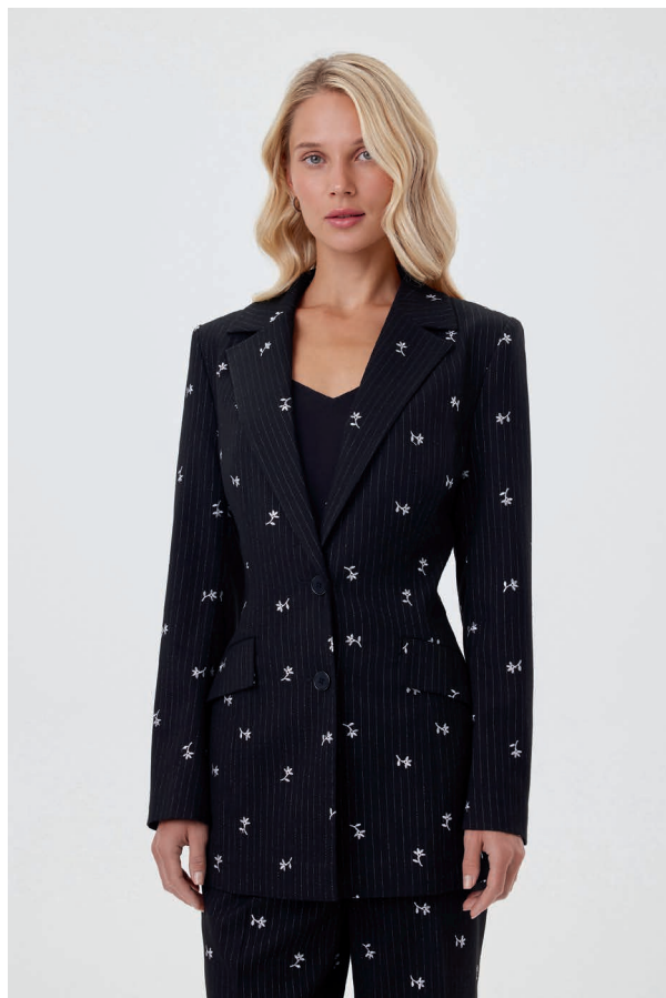
21-06-154 Жакет «Тёплые ночи» 21-06-166 Топ «Тёплые ночи» 21-06-155 Брюки «Тёплые ночи»