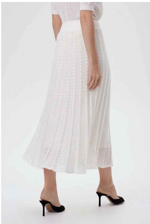
21-06-150 Джемпер поло «Утренний полет» 21-06-151 Юбка «Утренний полет»