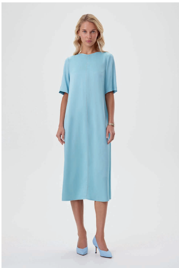
21-01-025 Платье «Лазурная прогулка»