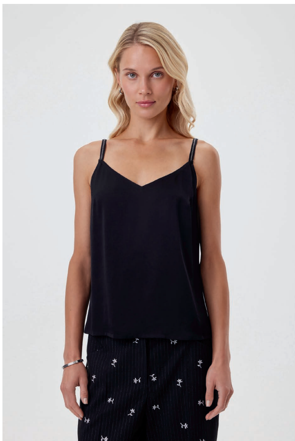
21-06-166 Топ «Тёплые ночи» 21-06-155 Брюки «Тёплые ночи»