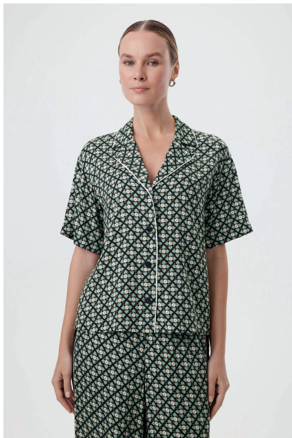
21-09-246 Блузка «Витраж» 21-09-247 Брюки «Витраж»