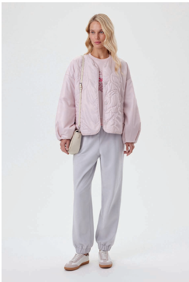
21-02-030 Куртка «Розовые мечты» 21-02-035 Свитшот «Розовые мечты» 21-02-041 Брюки «Променад»