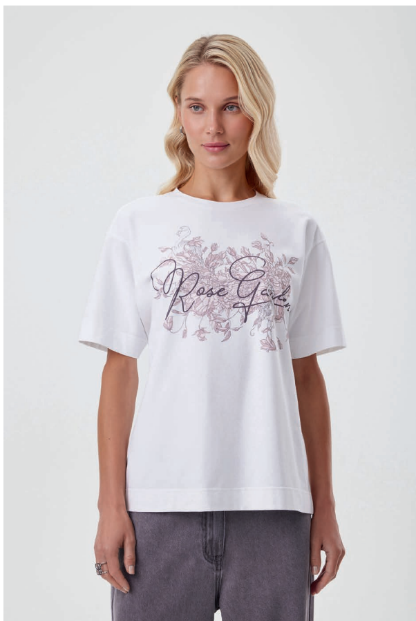
21-02-038 Футболка «Розовые мечты» 21-02-039 Брюки джинсовые серые