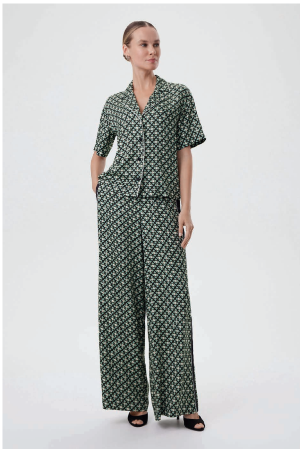
21-09-246 Блузка «Витраж» 21-09-247 Брюки «Витраж»