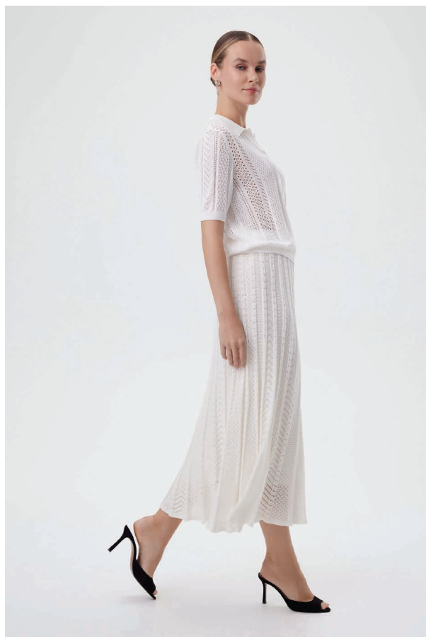
21-06-150 Джемпер поло «Утренний полет» 21-06-151 Юбка «Утренний полет»