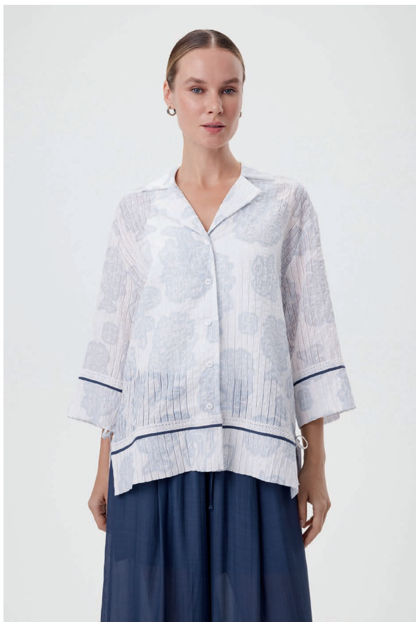
21-11-300 Блузка «Летние истории» 21-11-305 Брюки «Лунный сапфир»