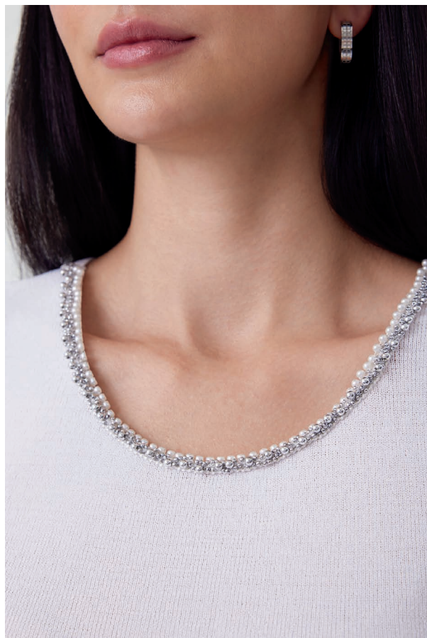
21-03-065 Топ вязаный белый