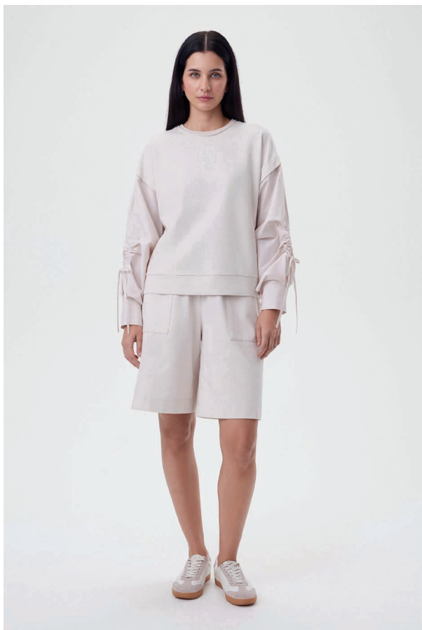
21-08-218 Свитшот «Оттенки миндаля» 21-08-221 Шорты «Оттенки миндаля»