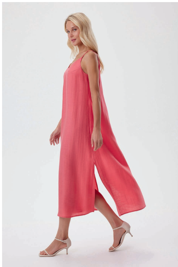
21-10-273 Платье «Вкус лета»