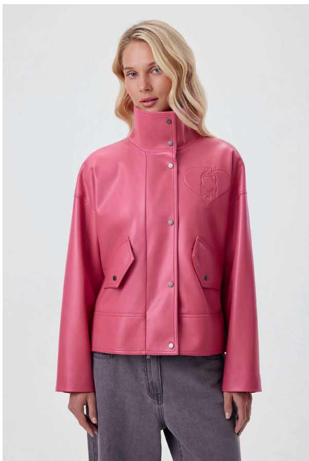
21-02-031 Куртка розовая «Семейные ценности» 21-02-039 Брюки джинсовые серые