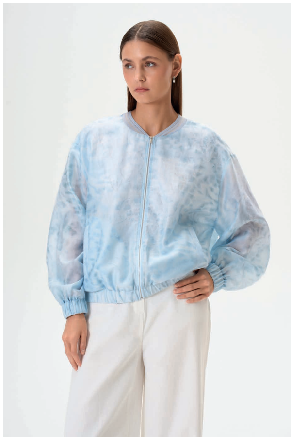
21-07-203 Блузон на молнии «Туманное утро» 21-05-129 Брюки джинсовые «Капель»