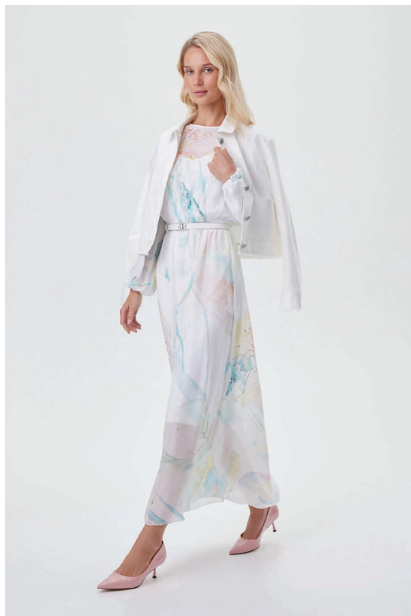
21-05-121 Жакет джинсовый «Капель» 21-05-133 Платье «Первоцветы» 07-01-061 Пояс АВ «88» белый 2 см