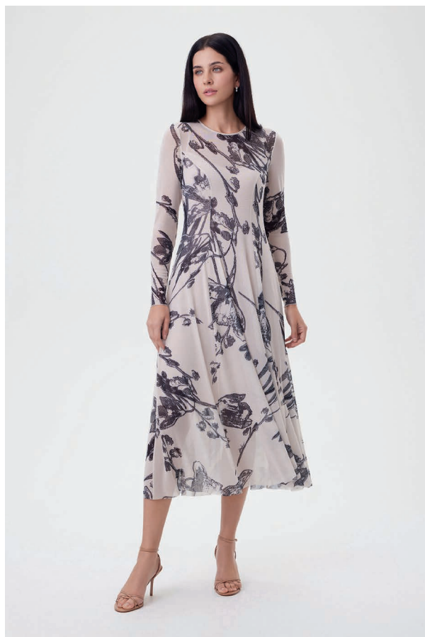
21-04-107 Платье «Силуэт весны»