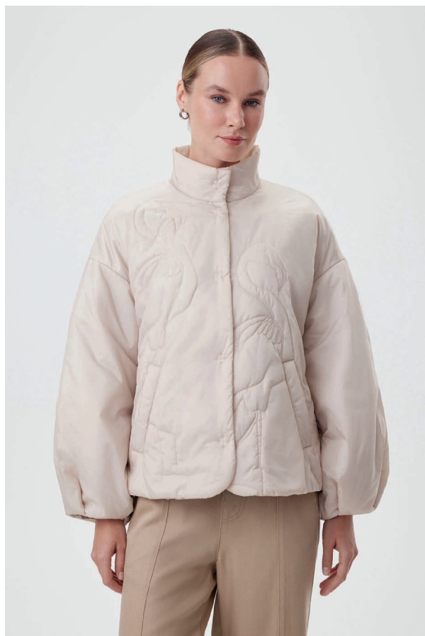
21-04-106 Куртка «Дуэт» 21-04-098 Брюки «Дуэт»