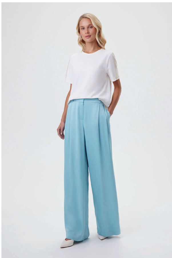
21-01-024 Футболка «Жемчужный мускат» 21-01-011 Брюки «Лазурная прогулка»