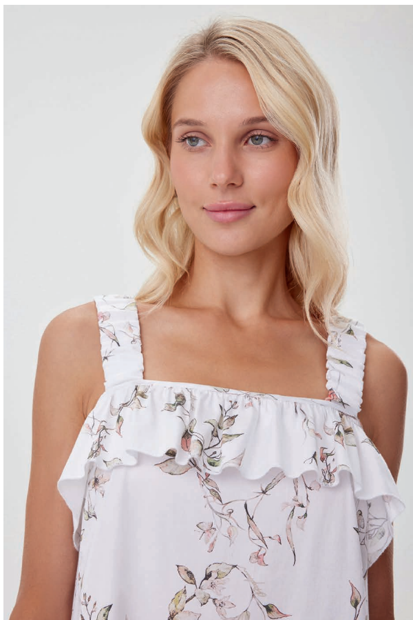
21-09-250 Сарафан «Флорариум»