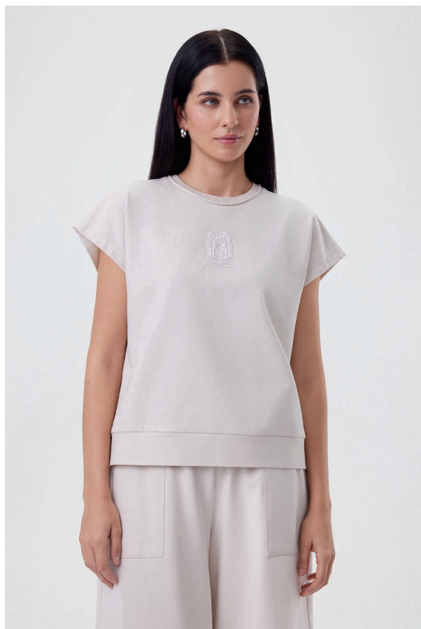
21-08-220 Джемпер «Оттенки миндаля» 21-08-221 Шорты «Оттенки миндаля»