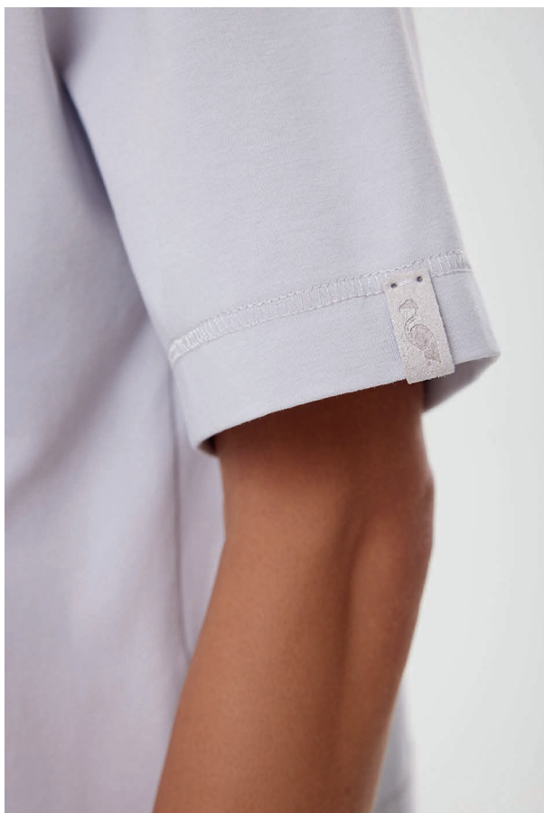
21-02-046 Футболка «Променад»