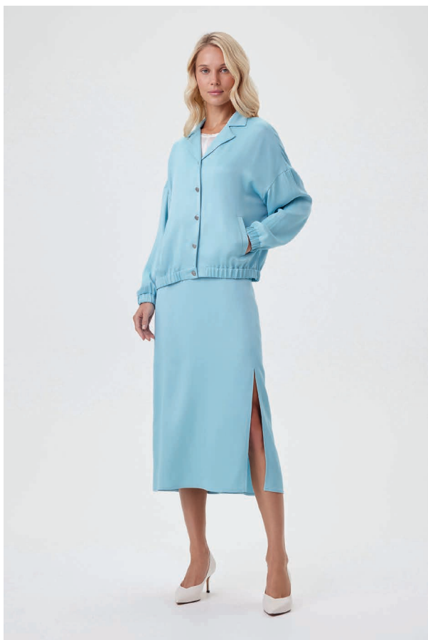
21-01-001 Блузон на пуговицах «Лазурная прогулка» 21-01-009 Топ молочный 21-01-013 Юбка «Лазурная прогулка»