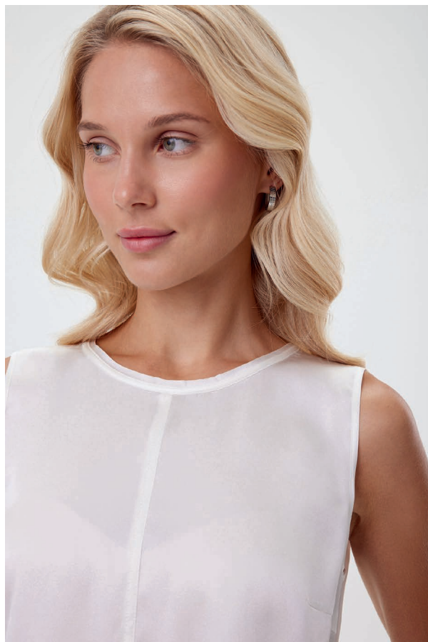
21-01-009 Топ молочный