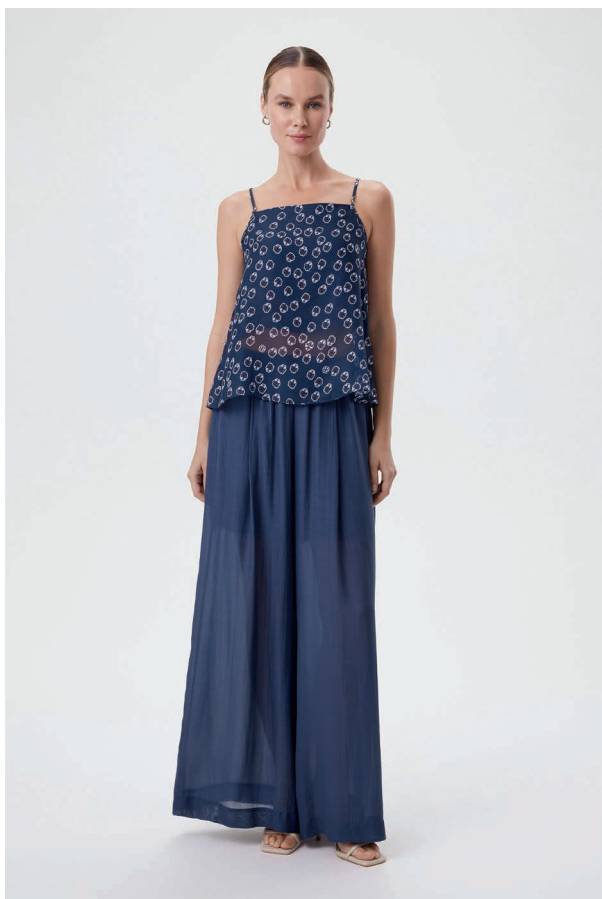
21-11-304 Топ «Вечерний сад» 21-11-305 Брюки «Лунный сапфир»