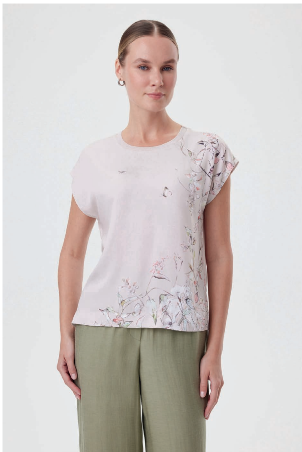
21-09-245 Блузка «Флорариум» 21-09-242 Брюки «Олива»