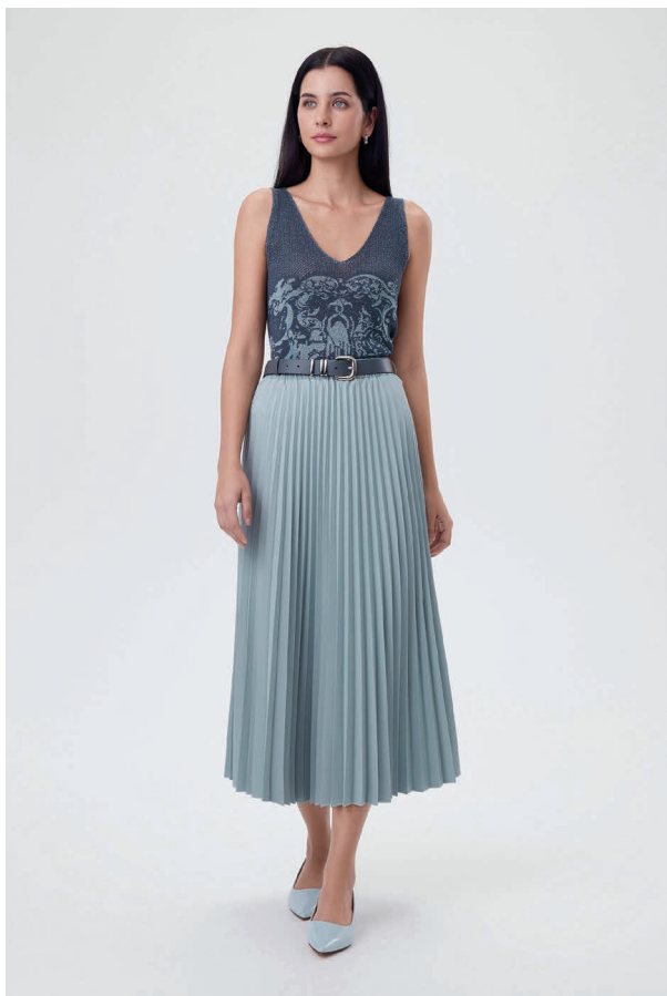
21-04-105 Топ «Триумфальные аллеи» 21-04-093 Юбка «Триумфальные аллеи» 07-01-066 Пояс АВ синий 2,5 см