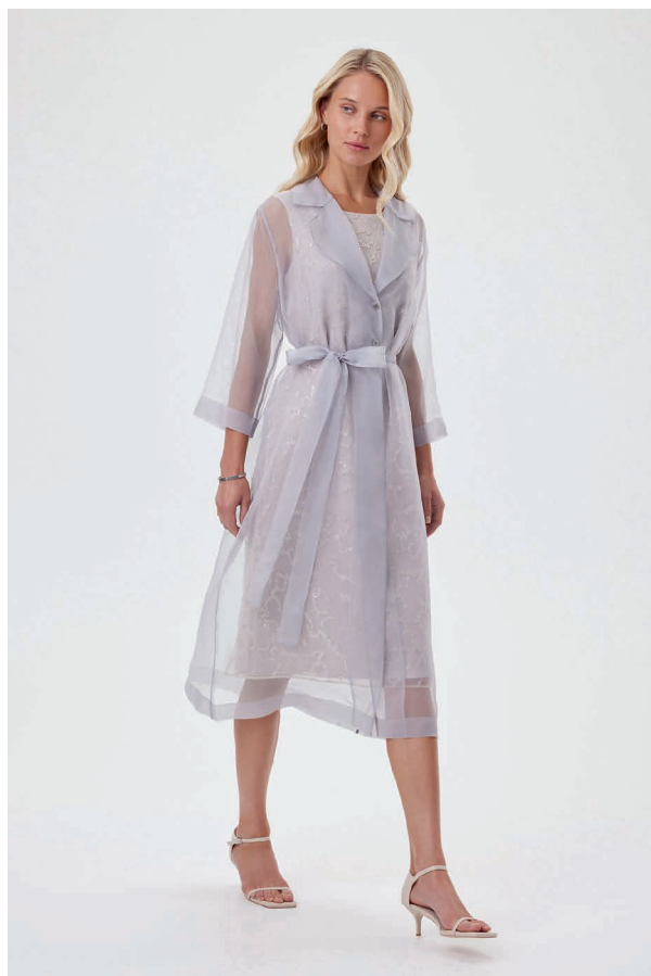
21-11-321 Тренчкот «Лунная вуаль» 21-11-320 Платье «Лунная вуаль»