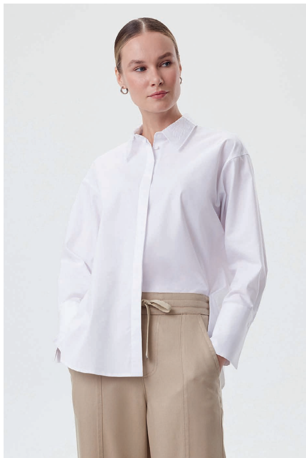
21-04-096 Блузка «Соната» 21-04-098 Брюки «Дуэт»