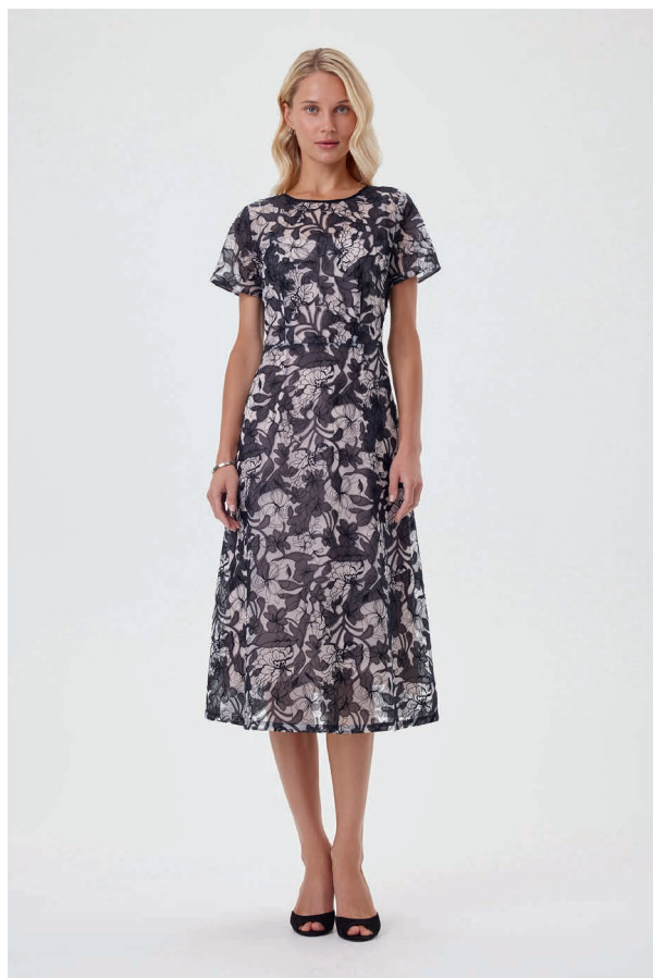
21-06-167 Платье «Тёплые ночи»