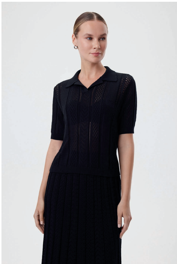
21-06-162 Джемпер поло «Тёплые ночи» 21-06-152 Юбка «Тёплые ночи»