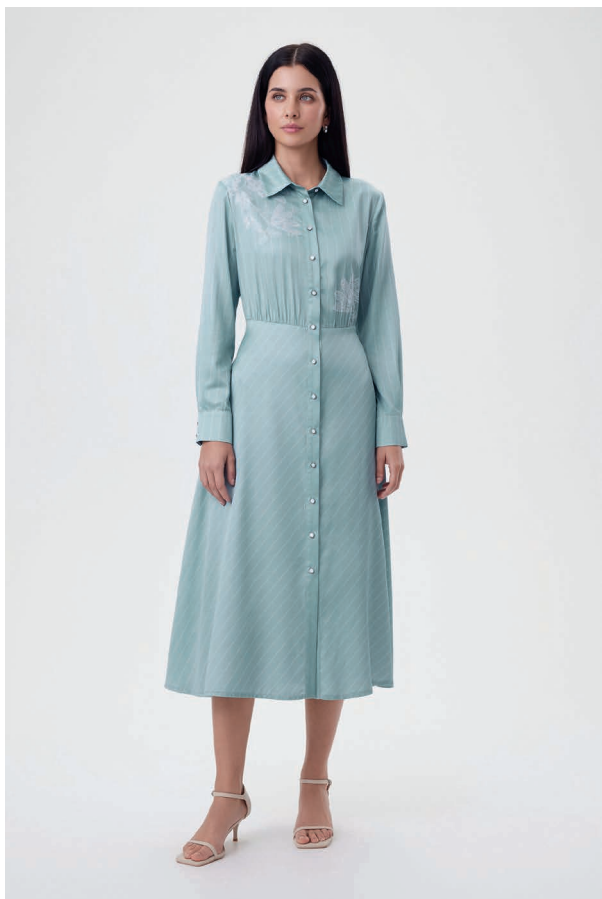
21-04-104 Платье «Триумфальные аллеи»