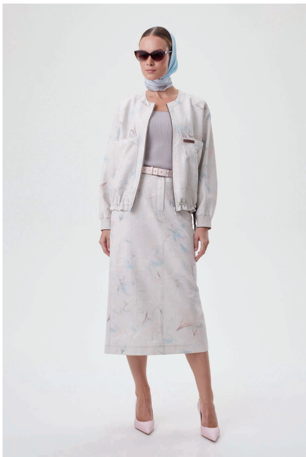
21-07-181 Блузон на молнии «Осязание» 21-07-185 Топ вязаный «Осязание» 21-07-182 Юбка «Осязание» 07-01-054 Пояс АВ пудровый 3 см