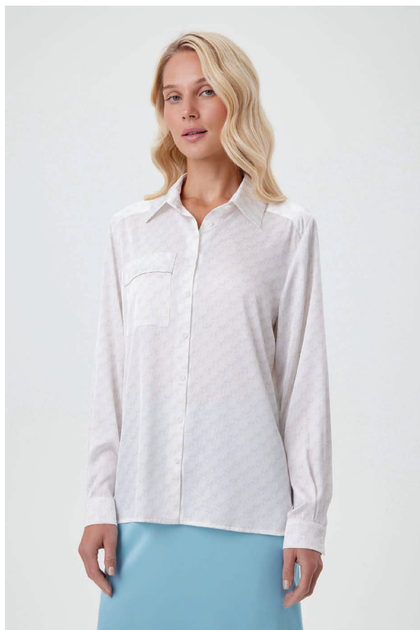
21-01-003 Блузка «Жемчужный мускат» 21-01-013 Юбка «Лазурная прогулка»