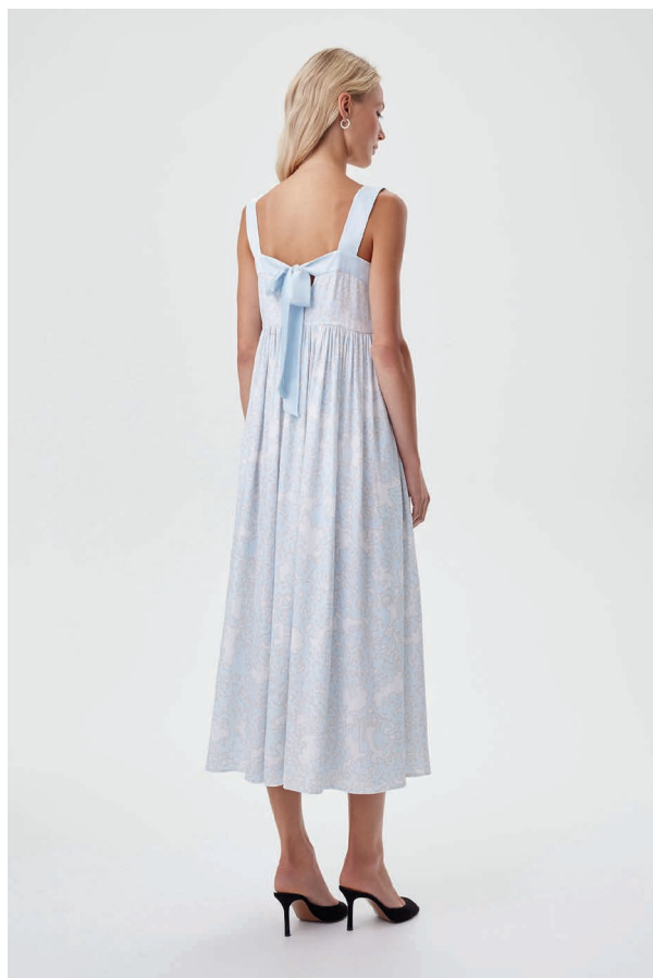
21-11-309 Сарафан «Летние истории»