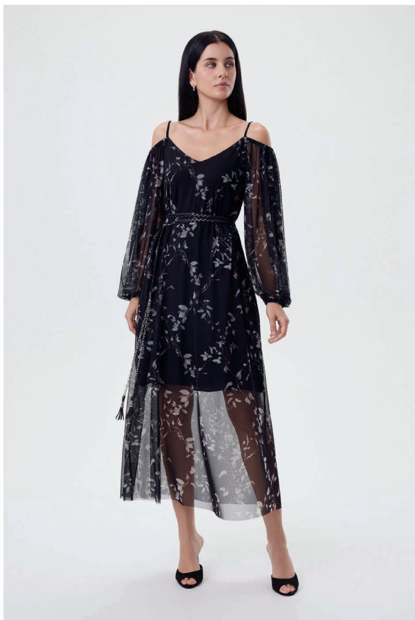
21-09-254 Платье «Летний вечер» 07-01-058 Пояс коса черный