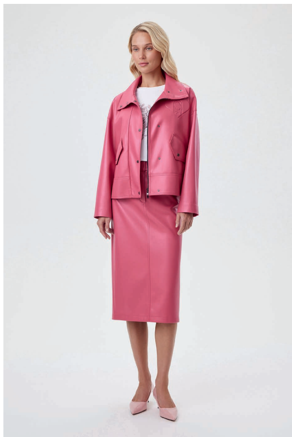
21-02-031 Куртка розовая «Семейные ценности» 21-02-038 Футболка «Розовые мечты» 21-02-040 Юбка розовая «Семейные ценности»