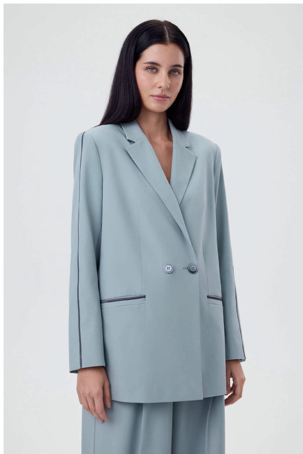
21-04-091 Жакет «Триумфальные аллеи» 21-04-092 Брюки широкие «Триумфальные аллеи»