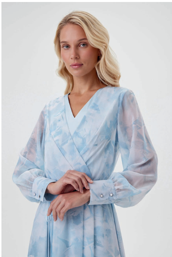
21-01-026 Платье «Дыхание облаков»