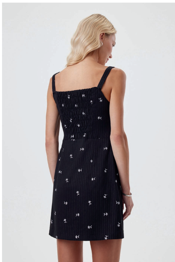
21-06-153 Платье прямое «Тёплые ночи»