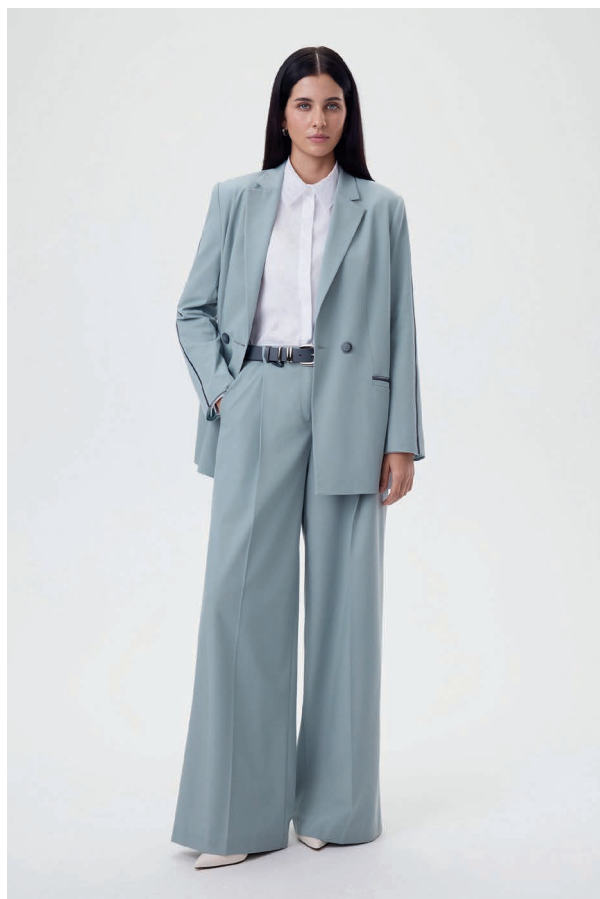
21-04-091 Жакет «Триумфальные аллеи» 21-04-096 Блузка «Соната» 21-04-092 Брюки широкие «Триумфальные аллеи» 07-01-066 Пояс АВ синий 2,5 см