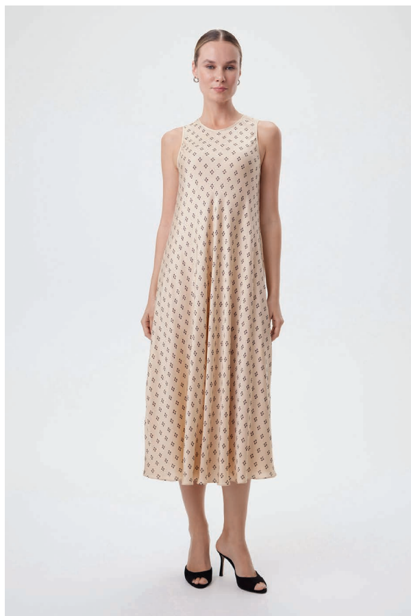
21-09-255 Платье «Витраж»