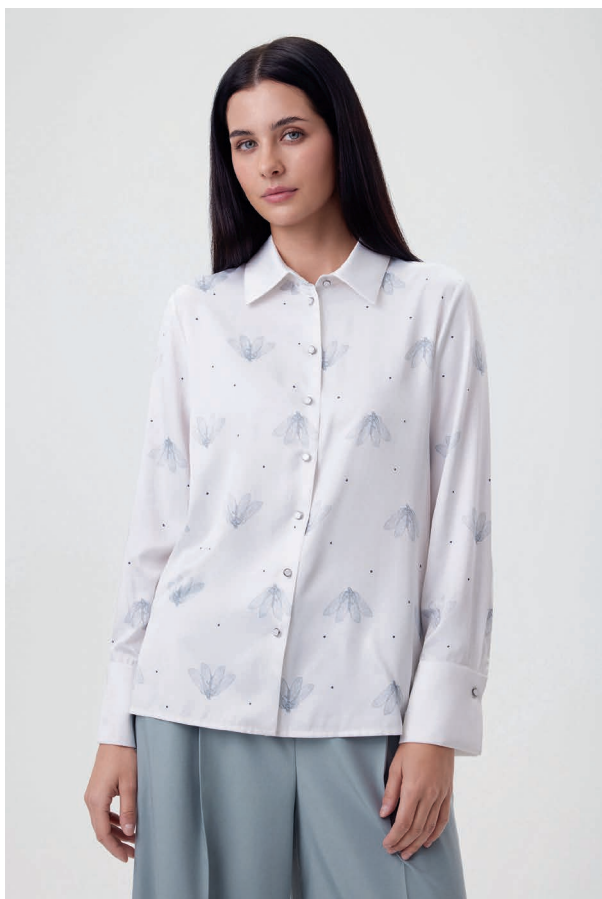
21-04-095 Блузка «Полёт» 21-04-092 Брюки широкие «Триумфальные аллеи»