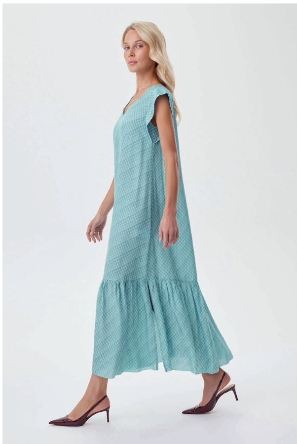
21-05-143 Платье «Лагуна»