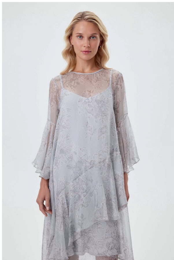
21-02-033 Платье с поясом «Небесная симфония»