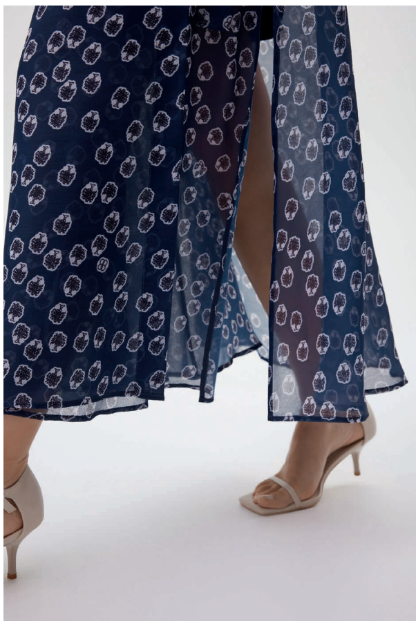
21-11-314 Платье «Вечерний сад»