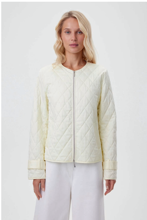
21-05-120 Куртка «Солнечный взгляд» 21-05-129 Брюки джинсовые «Капель»