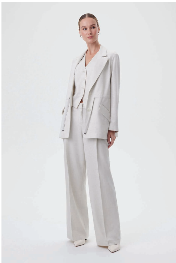
21-07-180 Жакет «Осязание» 21-07-186 Жилет «Осязание» 21-07-189 Брюки «Осязание»