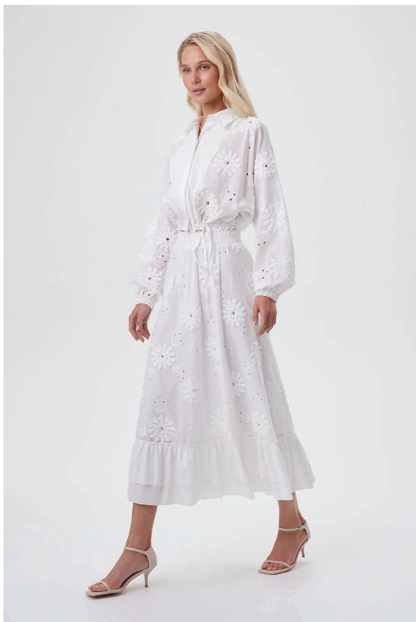
21-11-312 Блузон на пуговицах «Белый сад» 21-11-313 Юбка «Белый сад»