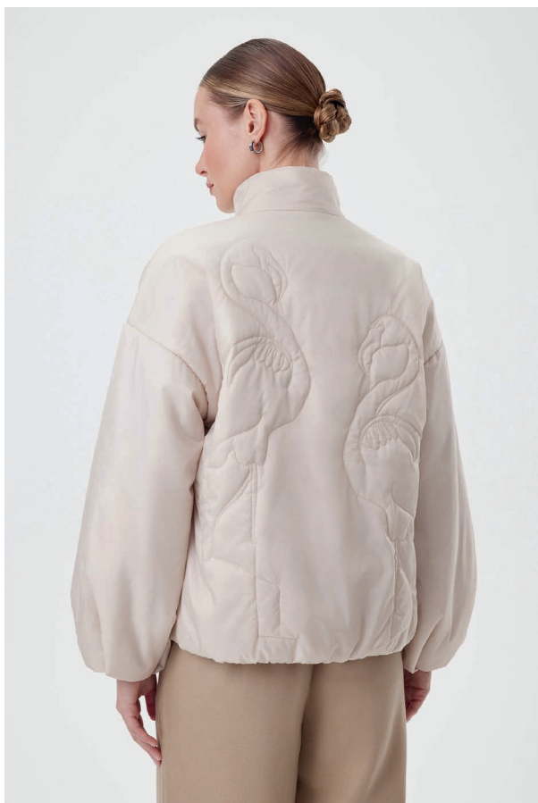
21-04-106 Куртка «Дуэт» 21-04-098 Брюки «Дуэт»