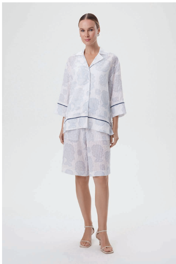
21-11-300 Блузка «Летние истории» 21-11-301 Шорты «Летние истории»