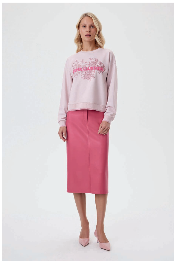
21-02-035 Свитшот «Розовые мечты» 21-02-040 Юбка розовая «Семейные ценности»