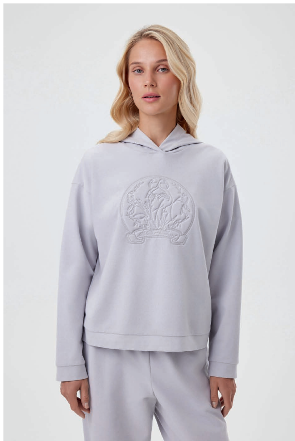
21-02-036 Худи «Променад» 21-02-041 Брюки «Променад»