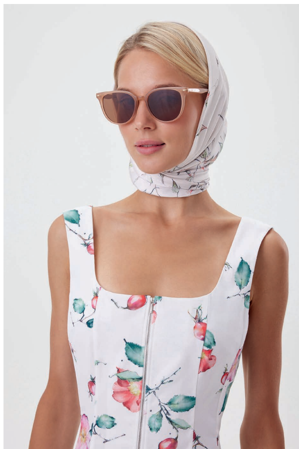
21-10-274 Сарафан «Эдем» 21-09-258 Платок «Флорариум» 09-01-017 Очки бежевые квадратные с футляром