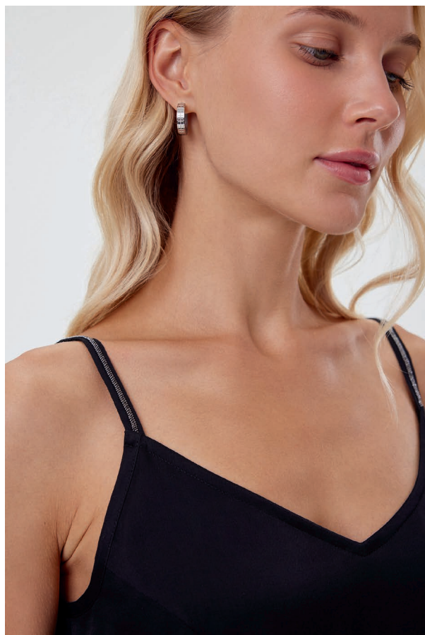
21-06-166 Топ «Тёплые ночи»