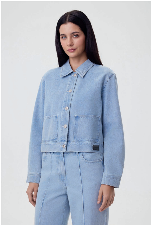
21-03-060 Куртка джинсовая «Городской полдень» 21-03-069 Брюки джинсовые «Городской полдень»