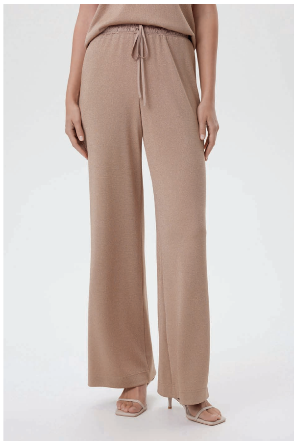
21-09-262 Топ «Золотая дюна» 21-09-261 Брюки «Золотая дюна»