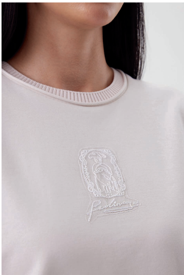
21-08-220 Джемпер «Оттенки миндаля»