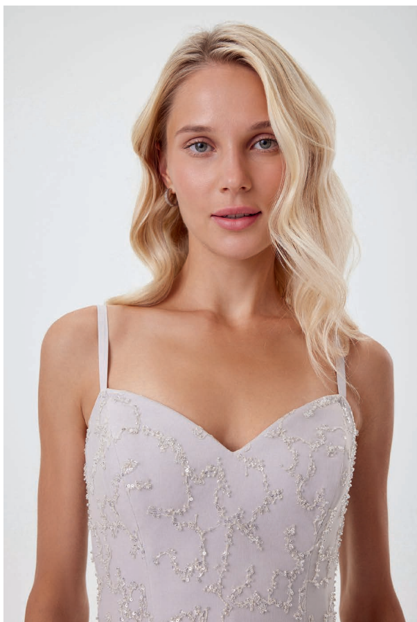
21-11-319 Платье со съёмной юбкой «Лунная вуаль»