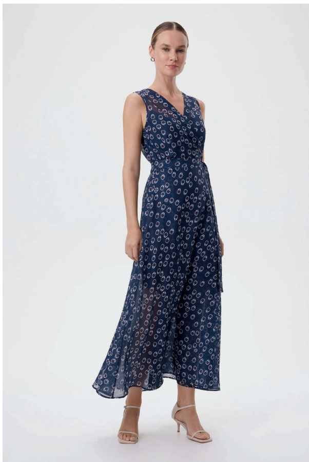
21-11-314 Платье «Вечерний сад»