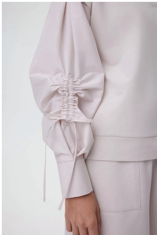
21-08-218 Свитшот «Оттенки миндаля» 21-08-221 Шорты «Оттенки миндаля»