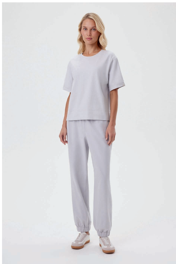
21-02-046 Футболка «Променад» 21-02-041 Брюки «Променад»