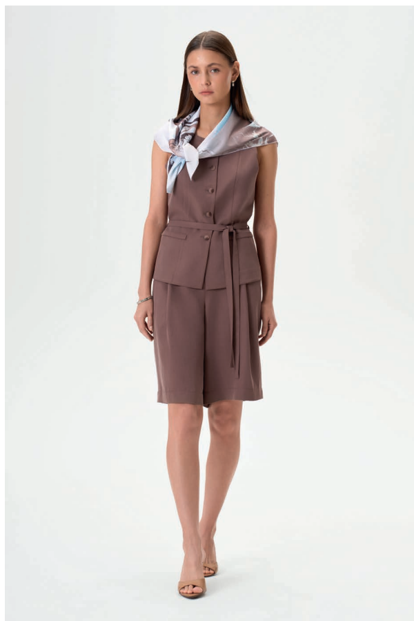
21-07-200 Жилет шоколадный 21-07-202 Шорты шоколадные 21-07-199 Платок «Осязание»