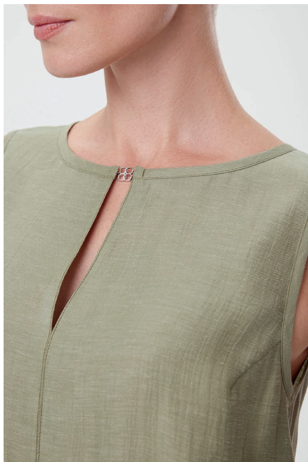
21-09-257 Топ «Олива»