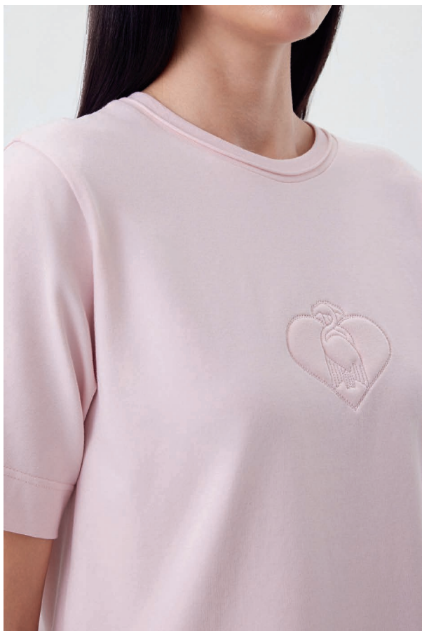
21-08-225 Футболка «Оттенки миндаля»