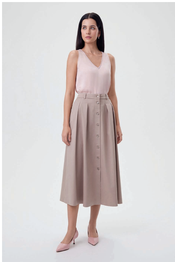
21-08-227 Топ «Оттенки миндаля» 21-08-214 Юбка «Оттенки миндаля»