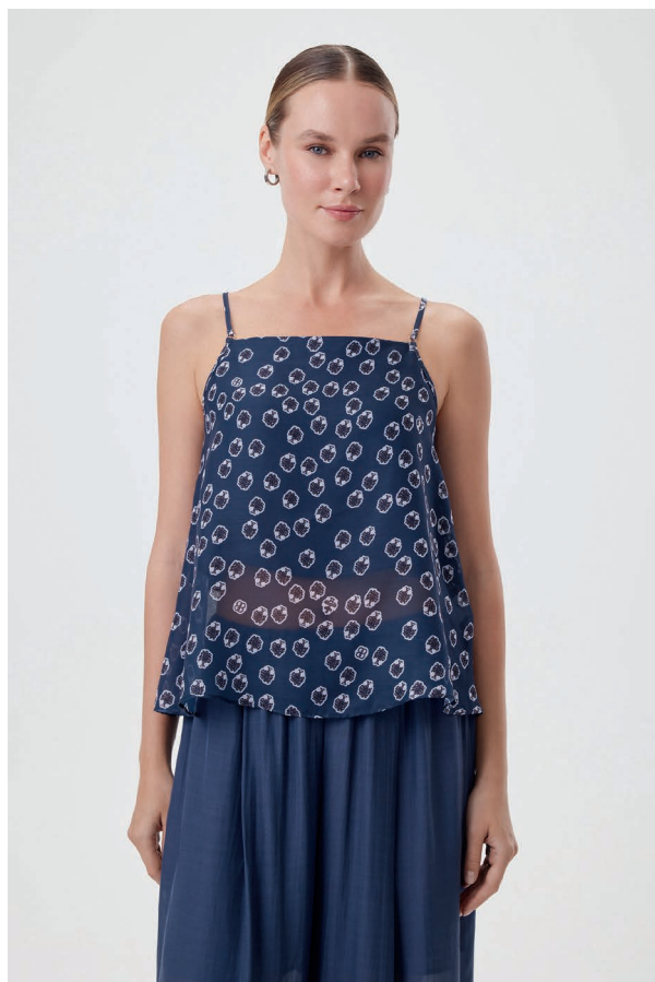
21-11-304 Топ «Вечерний сад» 21-11-305 Брюки «Лунный сапфир»