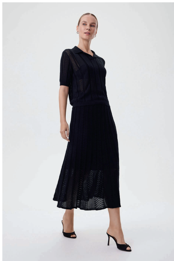
21-06-162 Джемпер поло «Тёплые ночи» 21-06-152 Юбка «Тёплые ночи»