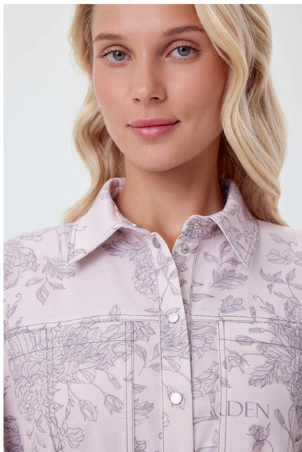
21-02-043 Платье с поясом «Розовые мечты»