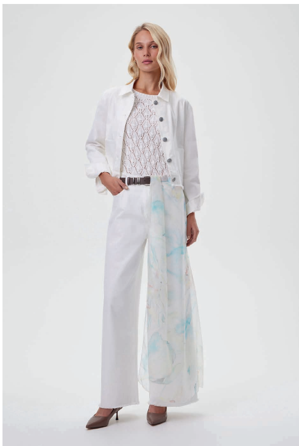
21-05-121 Жакет джинсовый «Капель» 21-05-140 Джемпер «Капель» 21-05-129 Брюки джинсовые «Капель» 07-01-065 Пояс АВ коричневый 2,5 см 21-05-142 Платок «Первоцветы»