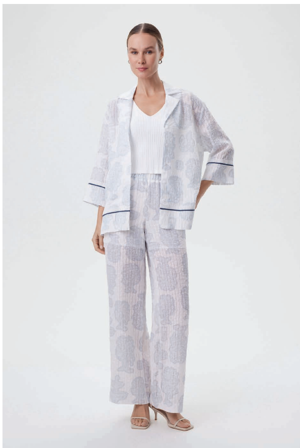
21-11-300 Блузка «Летние истории» 21-11-315 Топ вязаный «Летние истории» 21-11-303 Брюки «Летние истории»