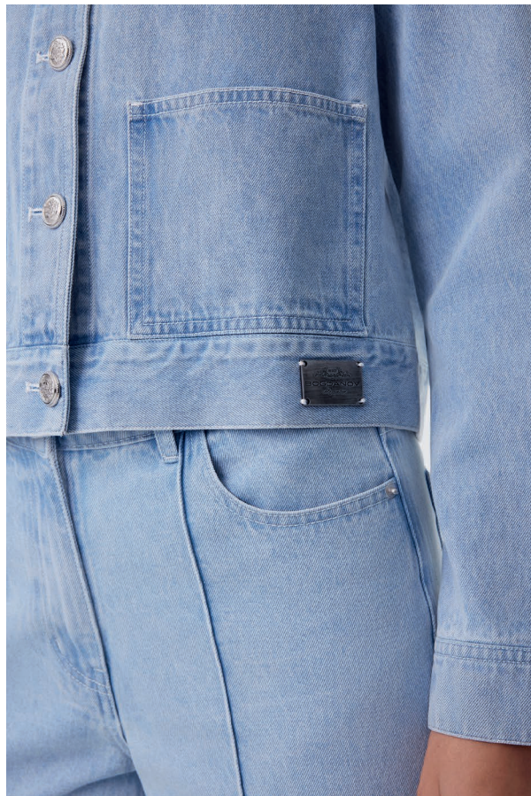
21-03-060 Куртка джинсовая «Городской полдень» 21-03-069 Брюки джинсовые «Городской полдень»