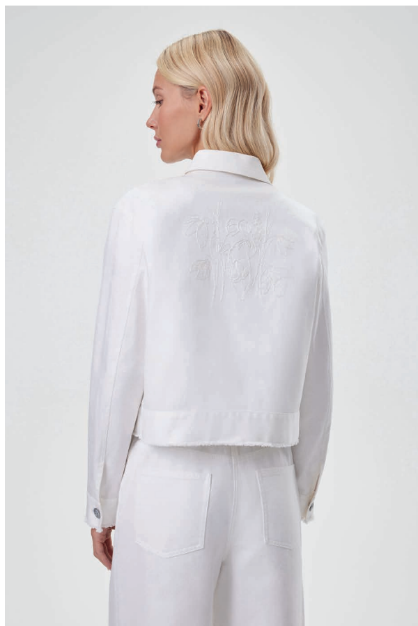
21-05-121 Жакет джинсовый «Капель» 21-05-129 Брюки джинсовые «Капель»