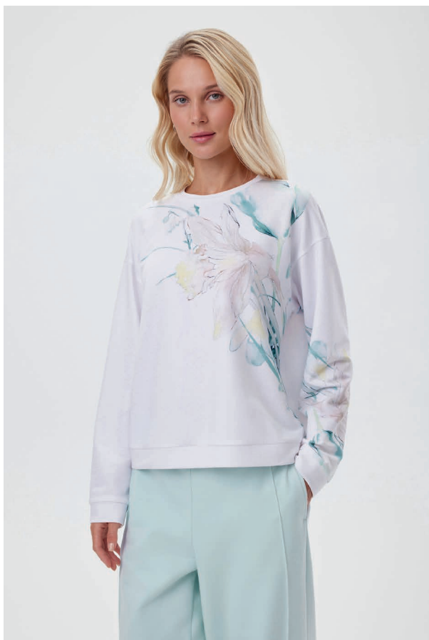
21-05-135 Свитшот «Первоцветы» 21-05-128 Брюки «Первоцветы»