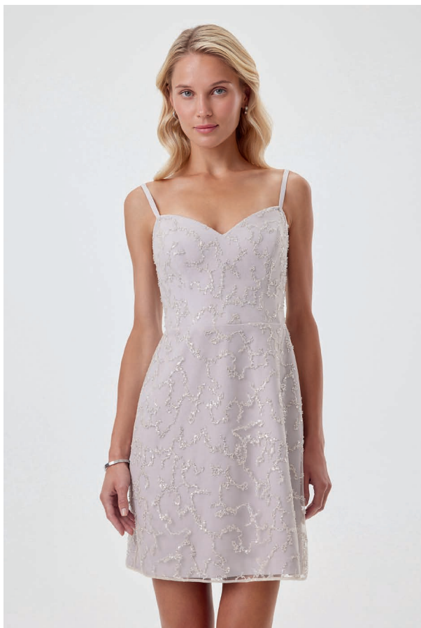
21-11-319 Платье со съёмной юбкой «Лунная вуаль»