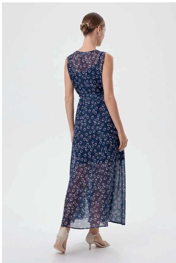
21-11-314 Платье «Вечерний сад»