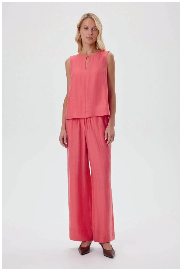
21-10-271 Топ «Вкус лета» 21-10-272 Брюки «Вкус лета»