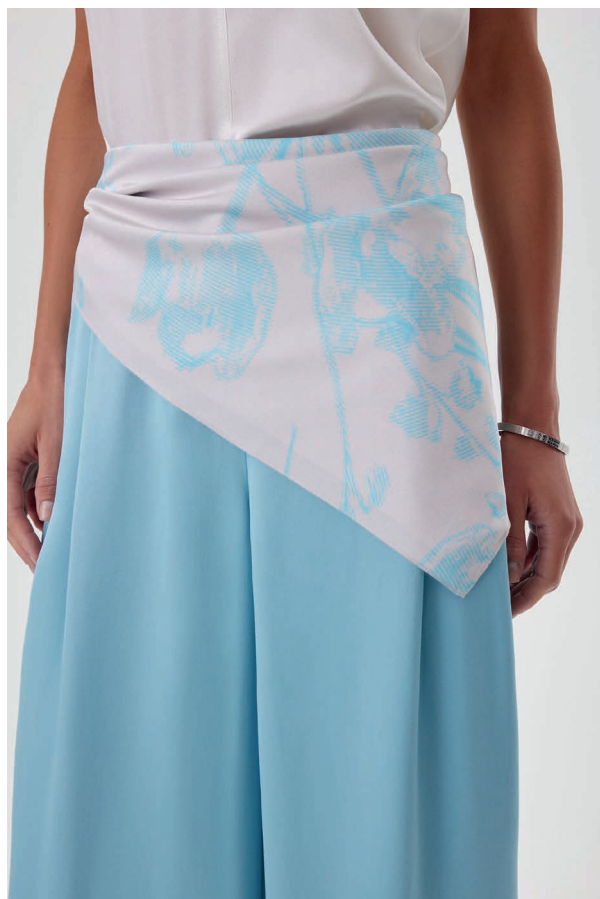
21-01-009 Топ молочный 21-01-011 Брюки «Лазурная прогулка» 21-01-022 Платок «Весенний бутон»