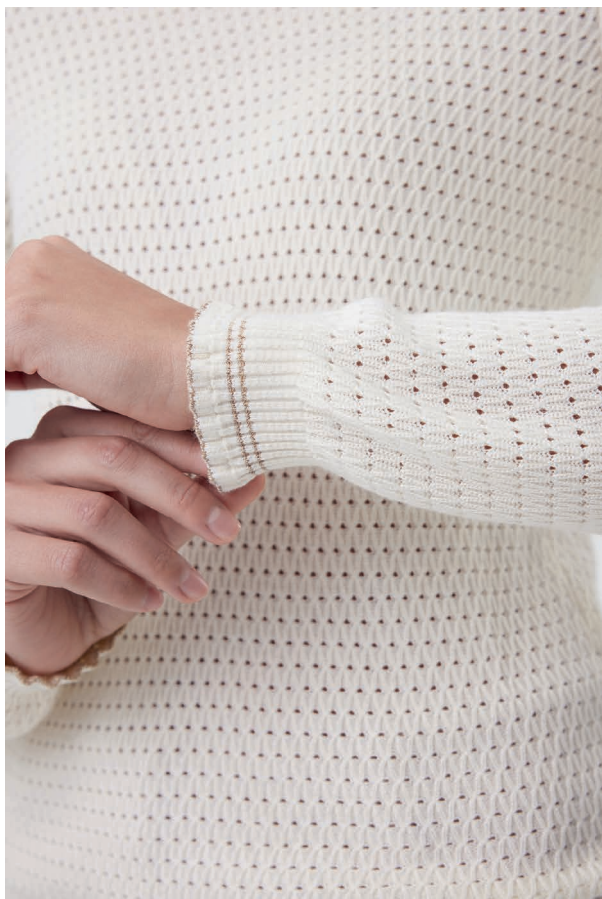
21-01-023 Джемпер «Жемчужный мускат»