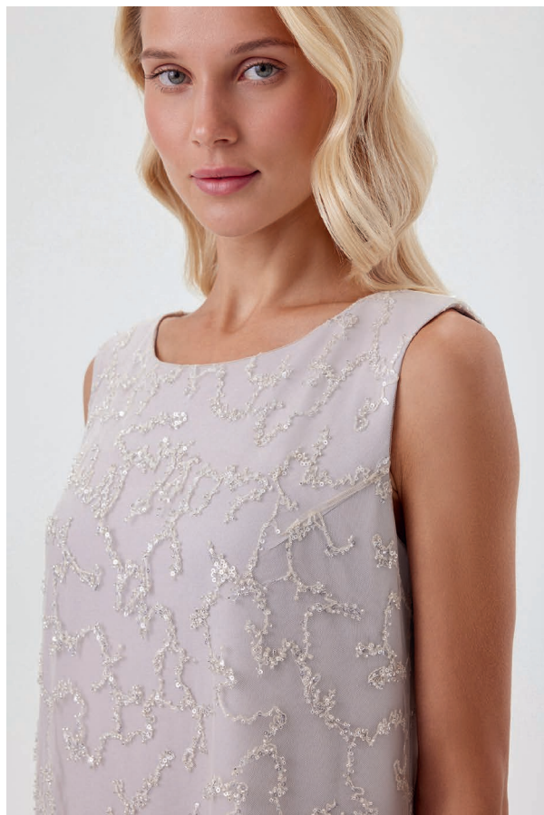
21-11-320 Платье «Лунная вуаль»