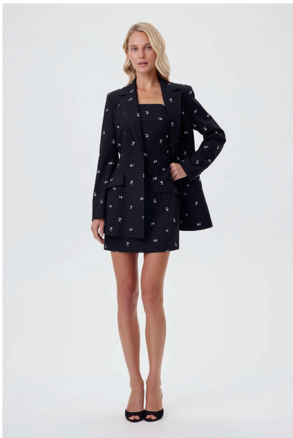
21-06-154 Жакет «Тёплые ночи» 21-06-153 Платье прямое «Тёплые ночи»