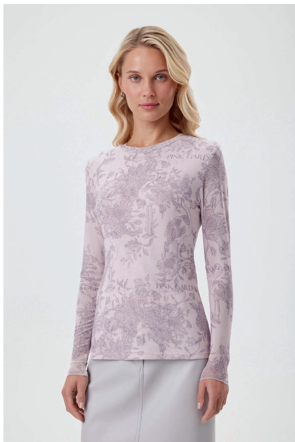
21-02-037 Джемпер «Розовые мечты» 21-02-044 Юбка серая «Семейные ценности»