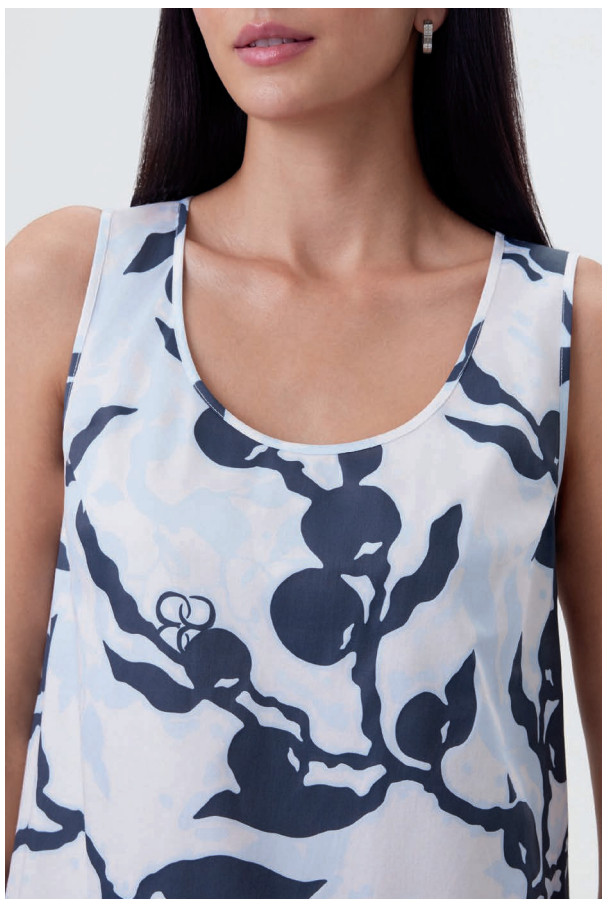
21-11-317 Сарафан «Вечерний сад»