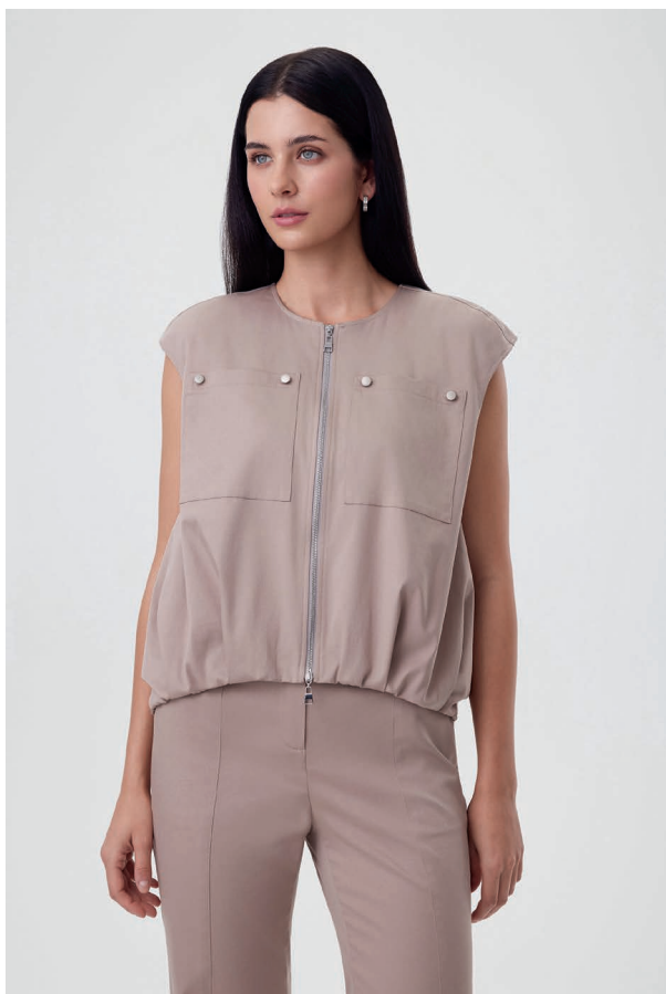
21-08-212 Жилет «Оттенки миндаля» 21-08-222 Брюки «Оттенки миндаля»