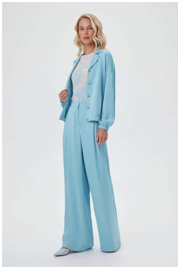
21-01-001 Блузон на пуговицах «Лазурная прогулка» 21-01-020 Джемпер «Весенний бутон» 21-01-011 Брюки «Лазурная прогулка»