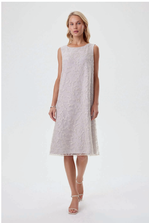
21-11-320 Платье «Лунная вуаль»