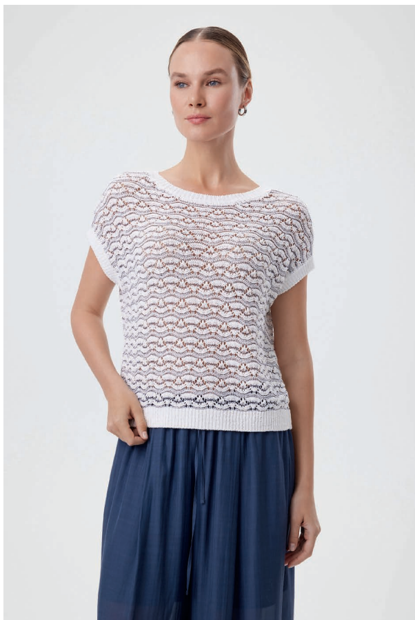
21-11-302 Джемпер «Летние истории» 21-11-305 Брюки «Лунный сапфир»